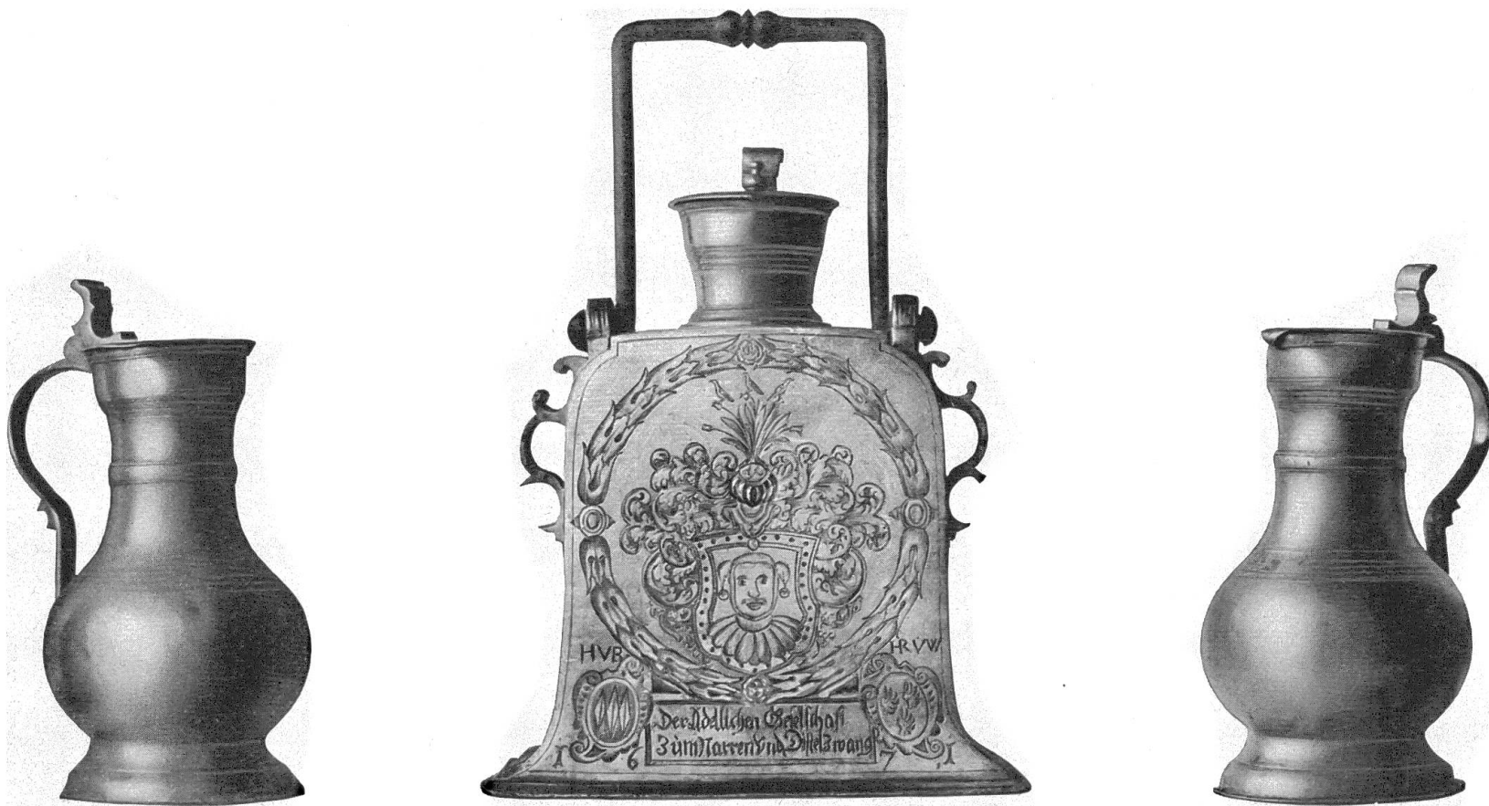
Zinnkannen der Gesellschaft zu Distelzwang in Bern.