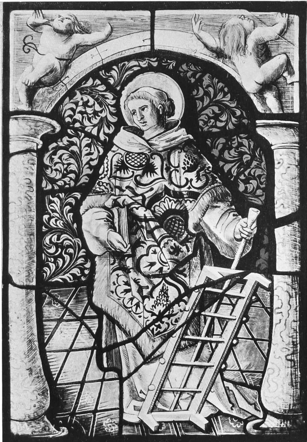
St. Laurentius. 16. Jahrh. Anfang.