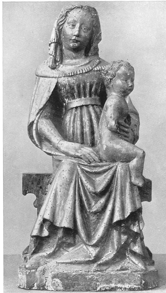
Abb. 2. Muttergottes aus Schwyz. Schweiz. Landesmuseum, Zürich.