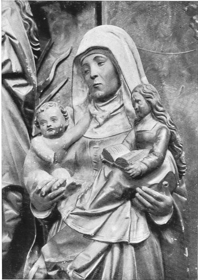
Abb. 4a. Sitten.