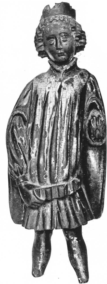
Abb. 3. König aus einer Epi- phanie. Aus dem Aargau. Bern. Histor. Museum, Bern.