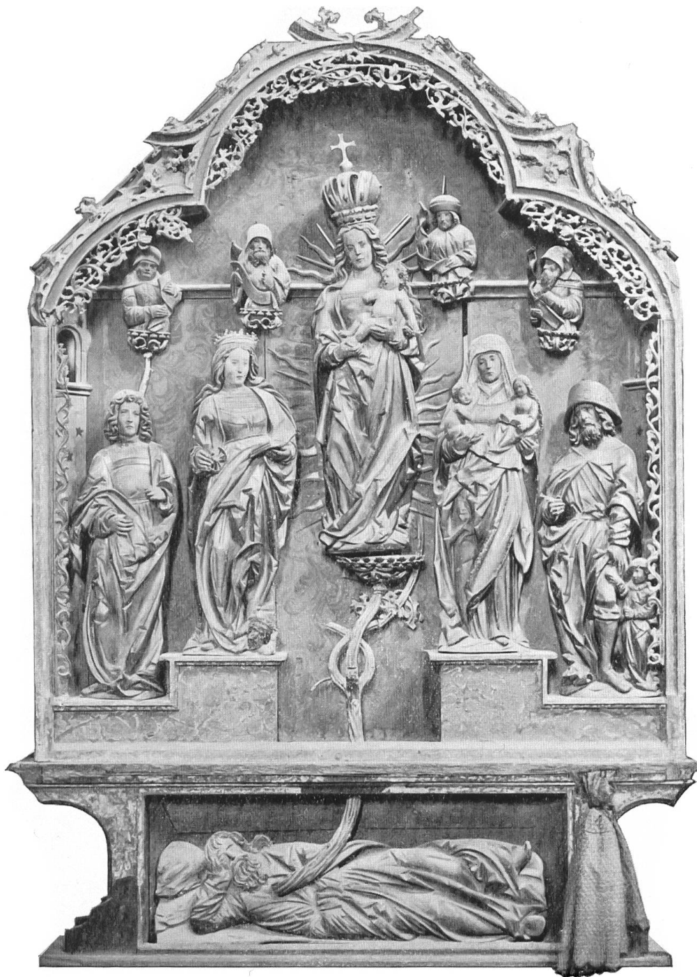
Abb. 4. Arbor-Jesse-Altar in der Collegiatskirche Valeria ob Sitten (Wallis).