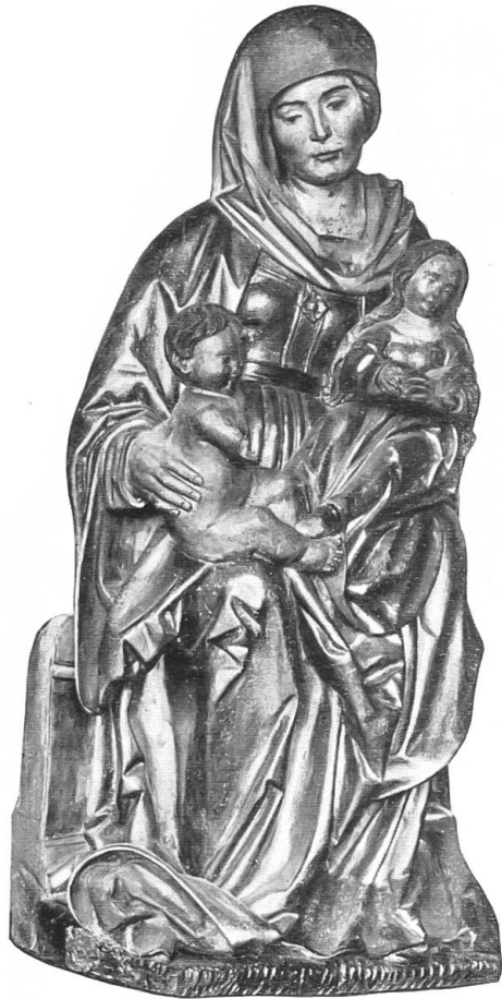
Abb. 6. Anna Selbdritt. Schweiz. Landesmuseum Zürich.