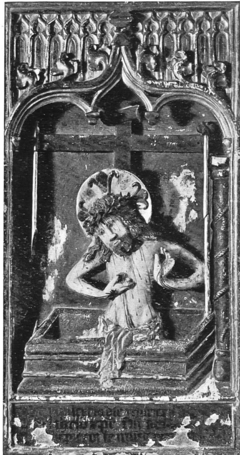
Abb. 1. Schmerzensmann. Bern. Histor. Museum, Bern.