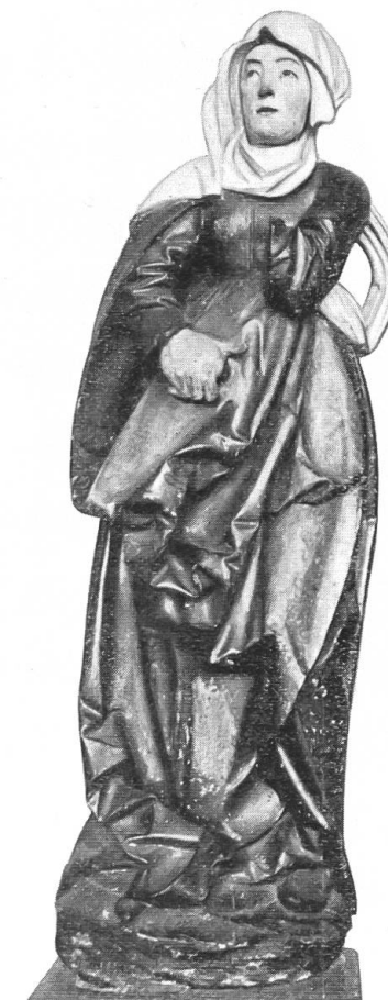
Abb. 5. Elisabeth(?). Aus dem Wallis. Bern. Histor. Museum, Bern.