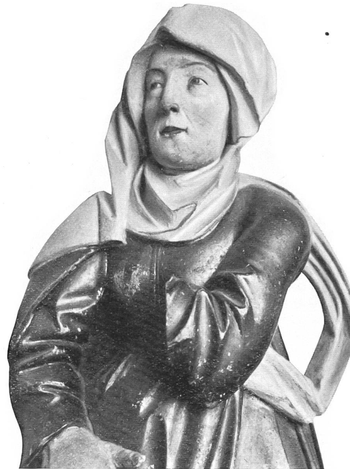
Abb. 5a. Bern.