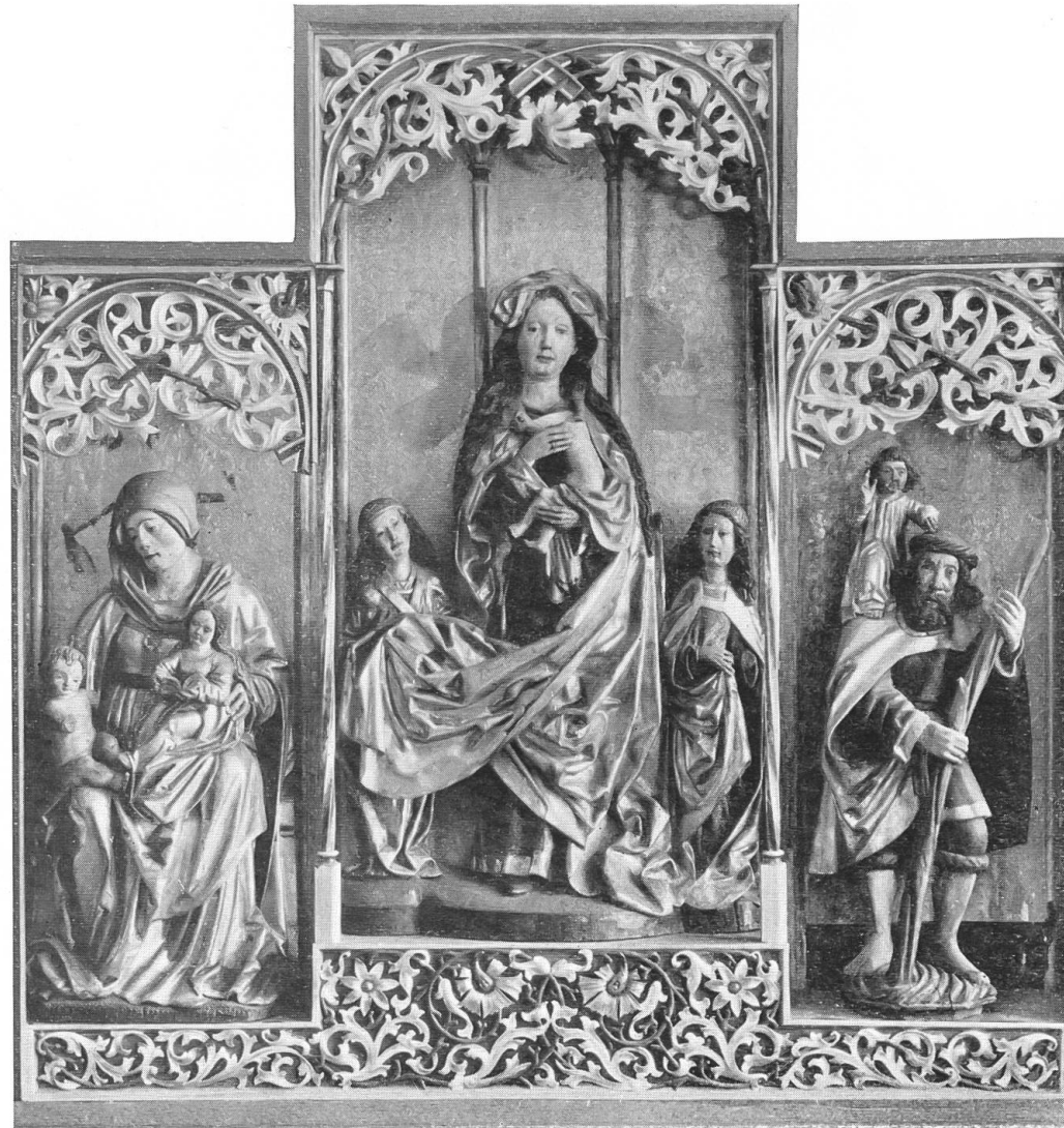
Abb. 7. Altar aus Naters im Wallis. Schweiz. Landesmuseum Zürich.