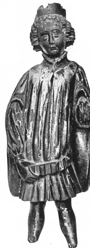
Abb. 3. König aus einer Epi- phanie. Aus dem Aargau. Bern. Histor. Museum, Bern.