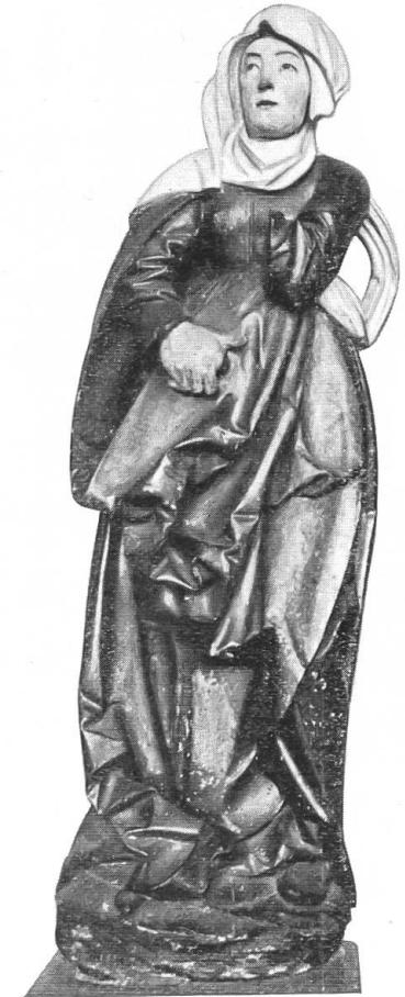
Abb. 5. Elisabeth(?). Aus dem Wallis. Bern. Histor. Museum, Bern.