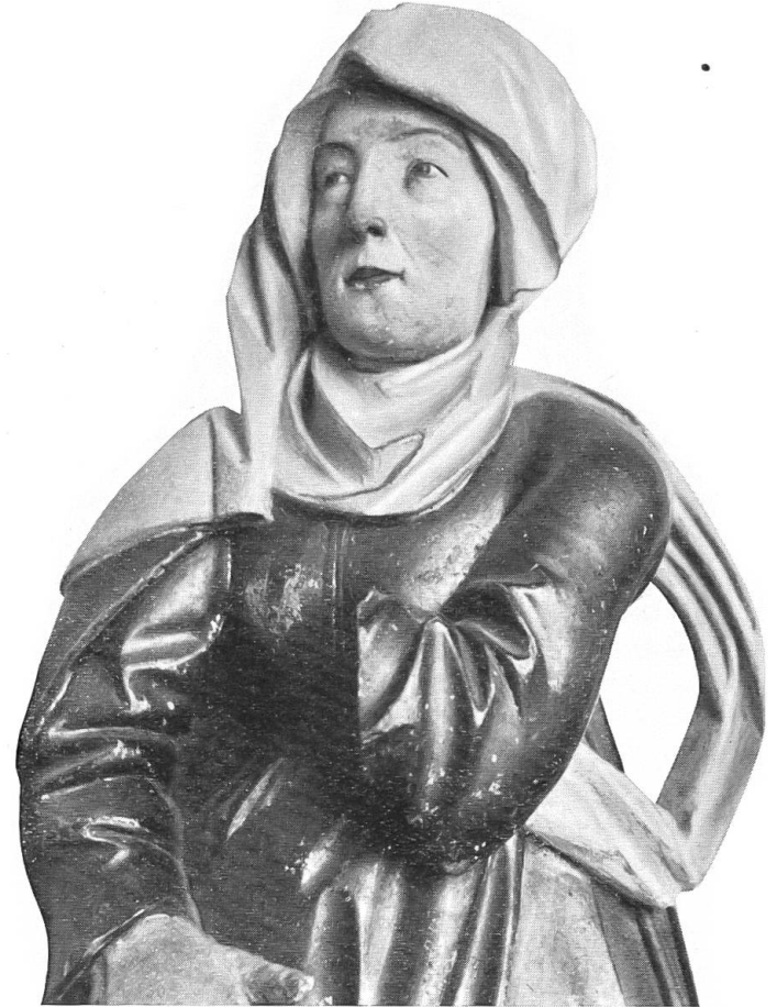
Abb. 5a. Bern.