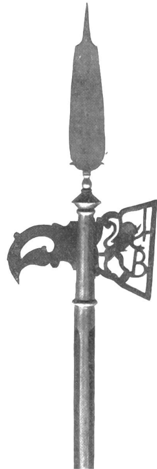
1621 Fig. 98.

Wie 1620. Die Spitze ist hinten fassoniert. Messingknauf. Beil und Haken aus Messing, im Beil Löwe mit B. Modellwaffe. — Fig. 98.