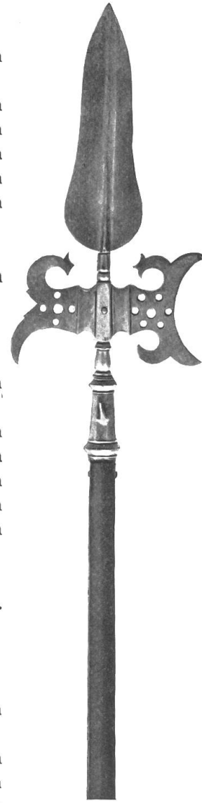
1609 Fig. 97.