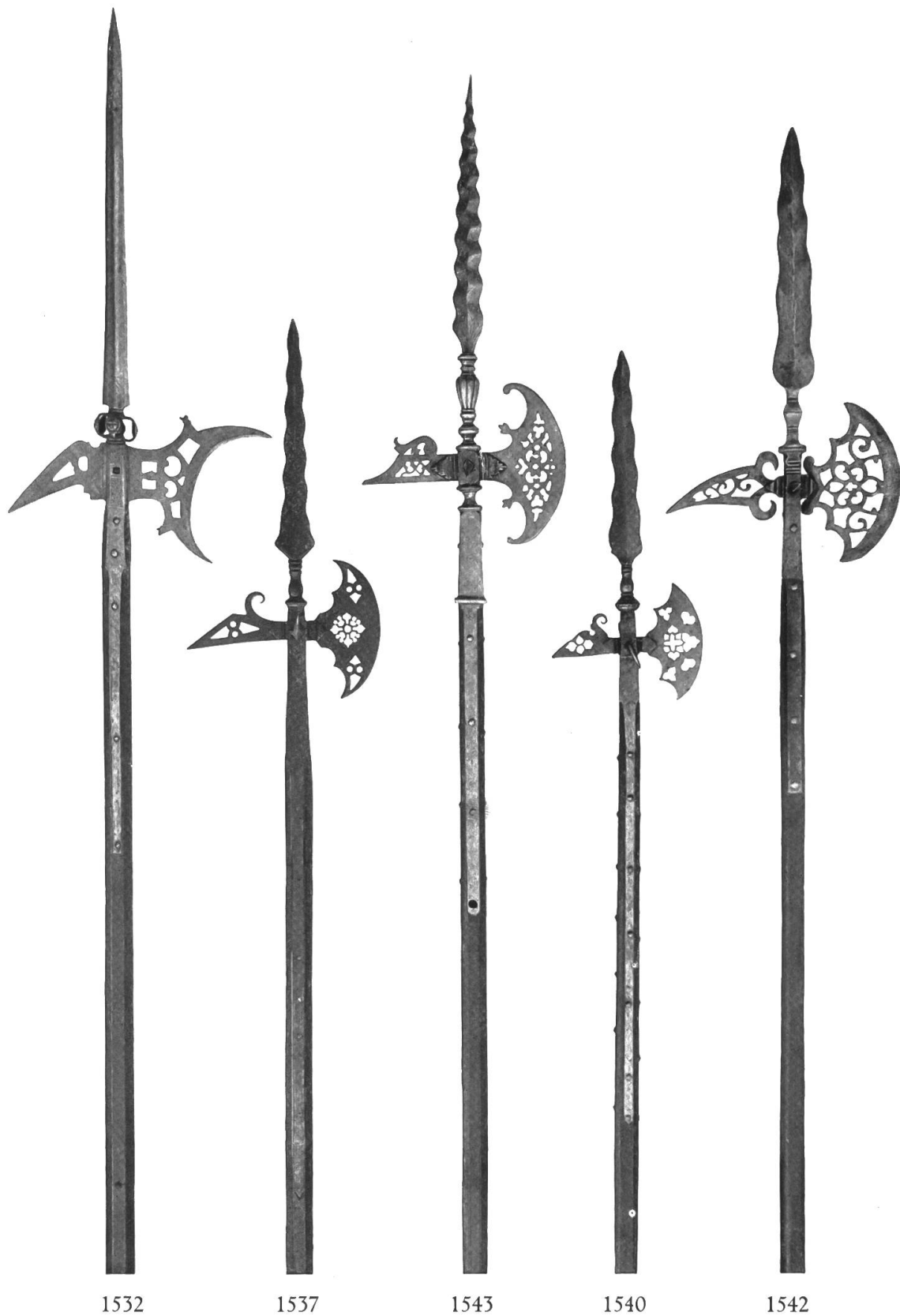
Tafel XIII. Offiziershalparten. 16.—17. Jahrh.