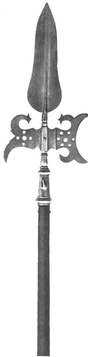
1609 Fig. 97.

Wie 1606. Parierdornen fehlen. Am Eisen Bernstempel, auf dem tannenen Schaft B G.