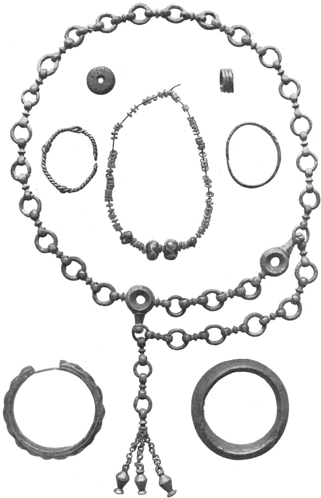
Thormannmätteli: Grab 3. Ungefähr \frac{1}{2} nat. Grösse