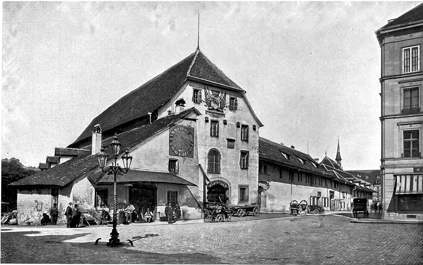
Zeughaus und Zeughausgasse.