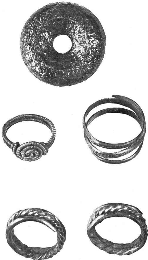
Latènefunde von Muri-Mettlen.

namens Mannenried näher umschrieben. Mannenried liegt in der Nähe unseres neuen Fundplatzes, und so ist es wahr- scheinlich, dass die Gräber von 1770 und 1929 einem grössern keltisch- römischen Gräberfeld gehören. Dass Muri eine wichtige keltisch-römische Kultstätte war, geht aus den hervor- ragenden Funden vom Schlossgut in Muri 1832 hervor. Der Fund bean- sprucht unser fernerer Interesse wegen der Beigaben an Gold- und Silber- ringen. Wir kennen ausser den zwei neuen Goldringen von Muri noch etwa 20 andere aus dem Gebiete der Schweiz. Meist sind es Spiralringe oder solche geknickter Form. Die Mehrzahl stammt aus dem Aaretal, die übrigen aus der Rhonegegend und aus dem Kanton Zürich. Der Spiral- ring von Muri weist ungefähr 2\frac{1}{2} Windungen auf. Aus flachem Gold- blech gewunden, ist er auf der Aus- senseite gepunzt worden. Die Ver-