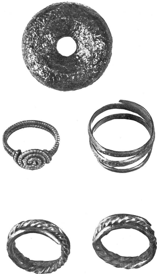
Latènefunde von Muri-Mettlen.