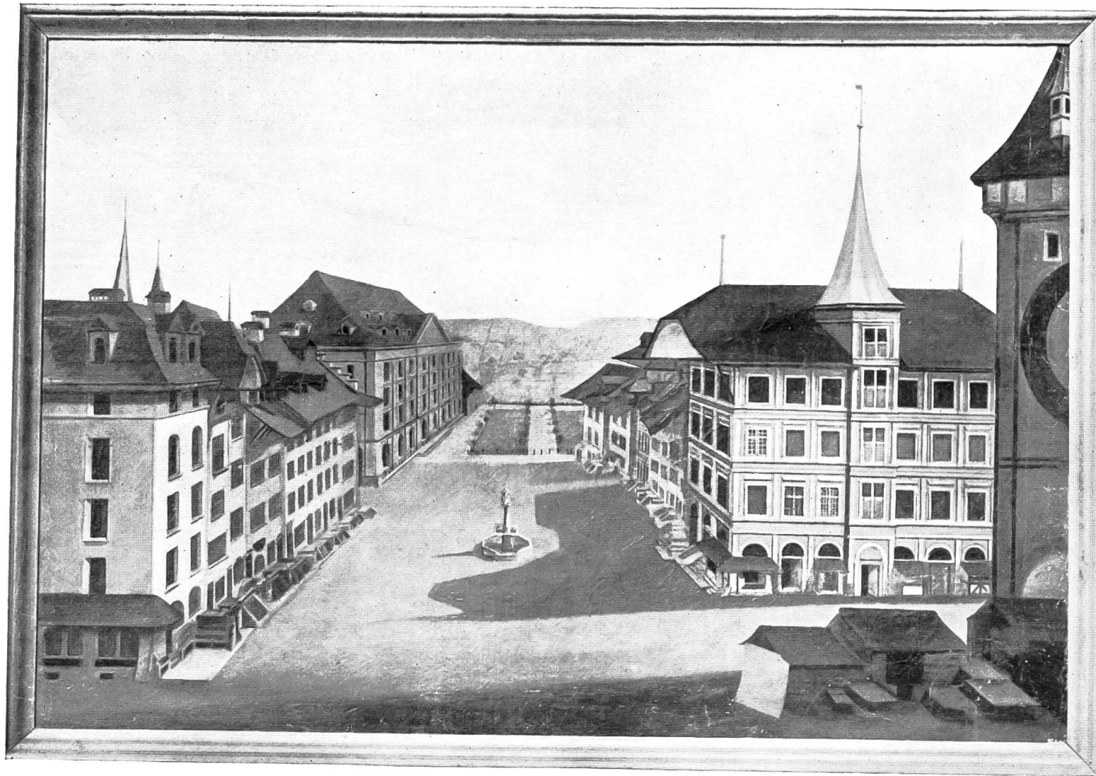
Ansicht des Kornhausplatzes von Süden aus dem Jahre 1740.