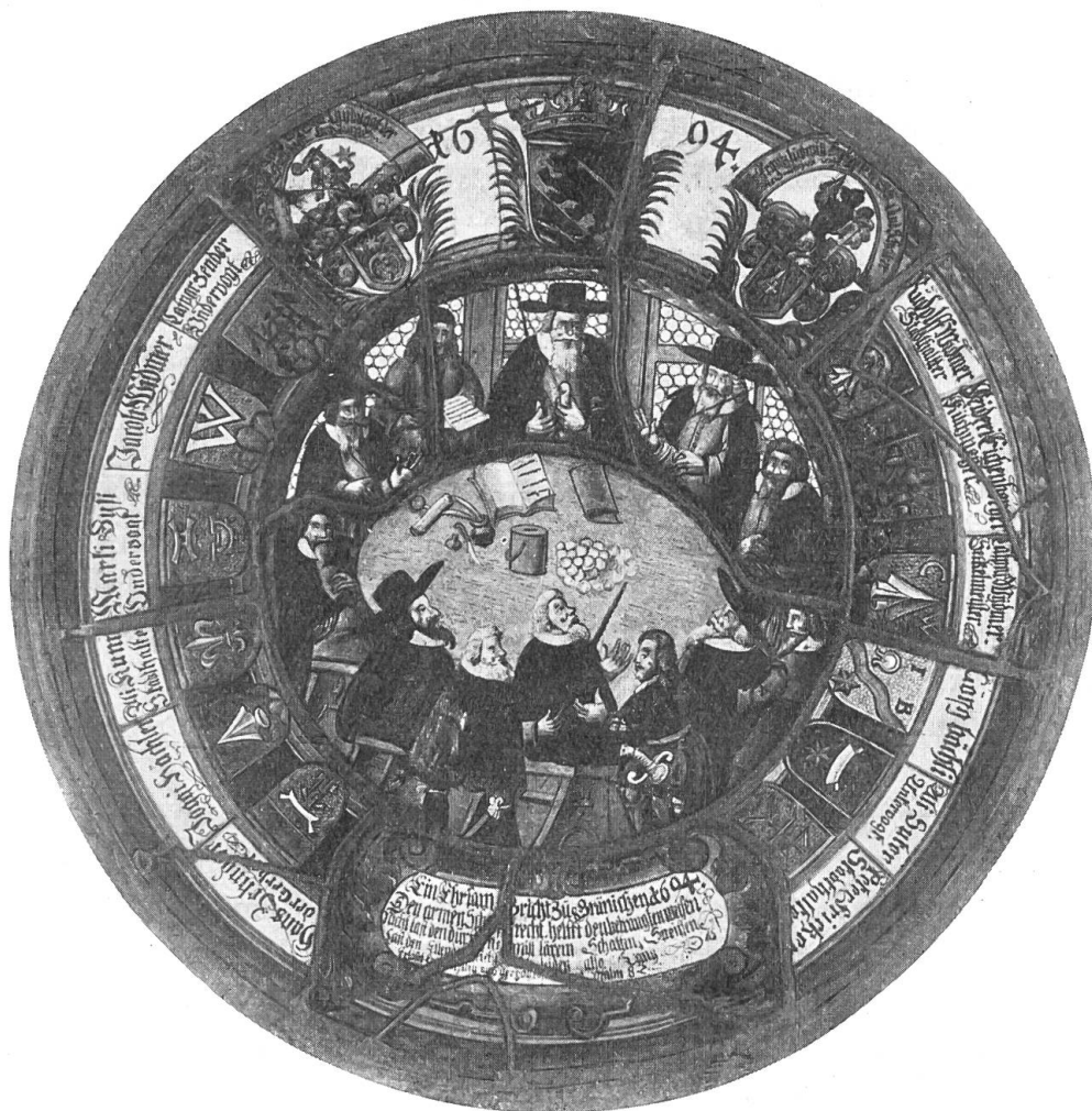
Gerichtsscheibe von Gränichen. 1694.