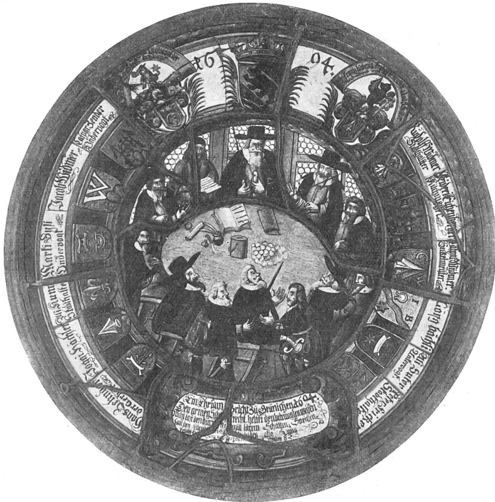
Gerichtsscheibe von Gränichen. 1694.