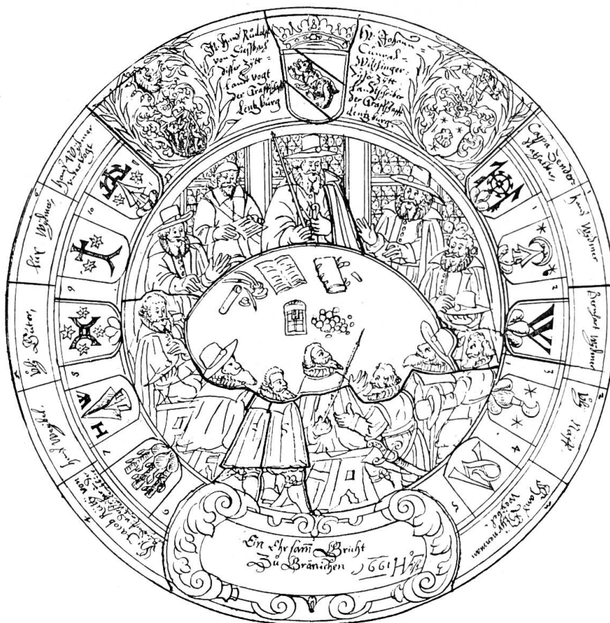
Riss zu der Gerichtsscheibe von Gränichen. 1661.