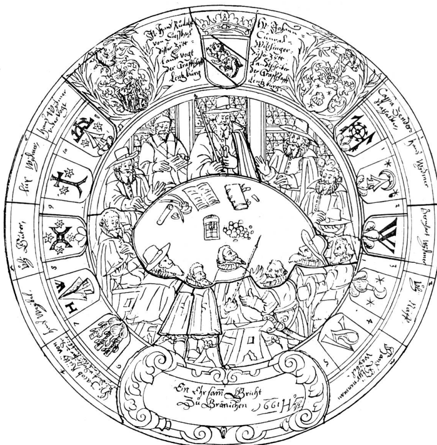
Riss zu der Gerichtsscheibe von Granichen. 1661.