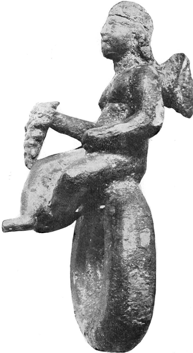
Provinzialrömische Bronze von Lugano. Ring von der Seite.

Guss mit dem Ringe fest verbunden. Auf der Rückseite sind geringe Spuren, die auf eine Verwendung des Ringes als Applikation an einem Geräte schliessen lassen. Die Meinungen kompetenter Fachleute über