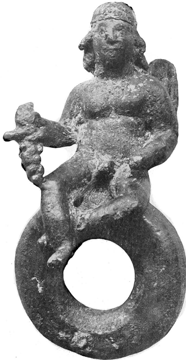
Provinzialrömische Bronze von Lugano. Bronzering von vorn.

Das Stück ist ein massiver Bronzering, auf dem eine geflügelte, männliche Gottheit aufsitzt. Ring und Figur erreichen die Höhe von 13 cm. Die Figur allein von der Sitzfläche gemessen 6,8 cm. Unter einer enganliegenden Kappe quellen Locken hervor und fallen auf die