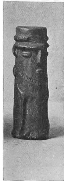
a) und b) aus dem Caucatal. c) Toncylinder der Chibcha, Bogotá.