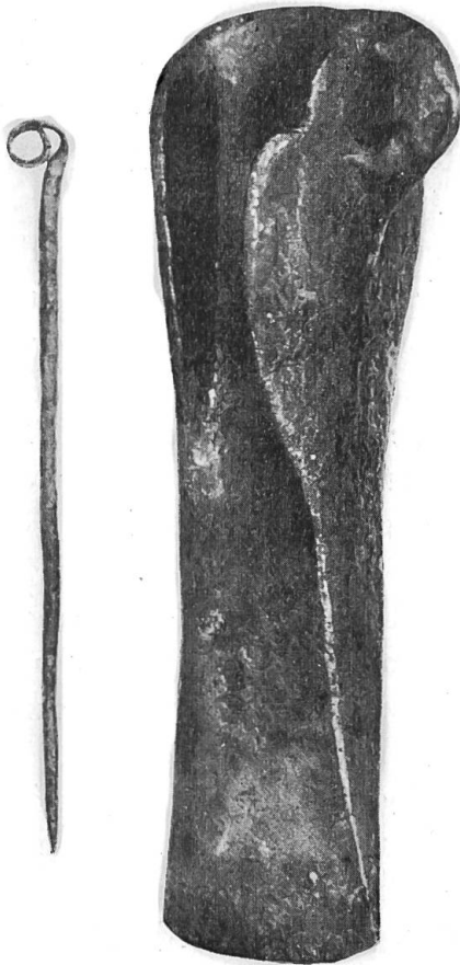
Thierachern Nadel und Axt.

dern auch die genauen Fundangaben und die Führung nach der Fundstelle. Zusammen mit Kohlenresten und einem angebrannten Stück Holz fand sich eine Rollennadel, die ans Ende der Bronzezeit zu setzen ist, etwa 300 m entfernt eine Lappenaxt von dem Typus, den man jetzt allgemein als oberständige Lappenaxt bezeichnet. Solche Stücke gehören