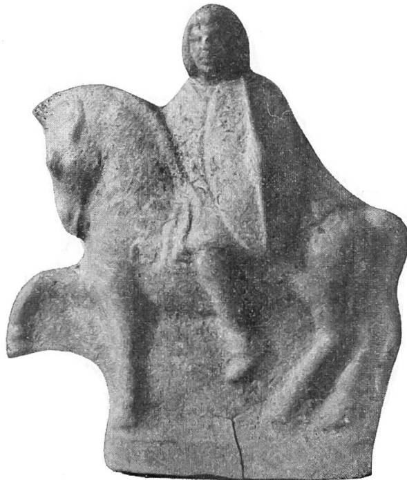
Figur eines (gallischen?) Reiters aus einer Höhle bei Bi'ne (Palästina).

Im zweiten Grab mit ebenfalls schlecht erhaltenem Skelett fanden sich: Am rechten Oberarm ein breiter Armring aus Lignit, sowie zwei gläserne Armringe mit profilierter Aussenseite, wovon der eine aus ungefärbtem, weissem Glase, der andere auf der Innenseite mit gelber