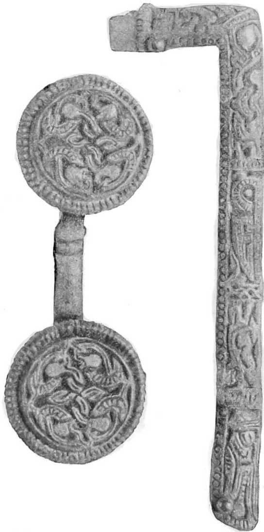
Papiermühle. Knopfpaar und Scheiden- beschläge aus Grab 24.

Grab 23 , in 1,2 m Tiefe, teilweise zerstört. Die Unterschenkel waren gekreuzt. Als einzige Beigabe fand sich ein Halsschmuck, bestehend aus 10 kleinen gelben, zwei grössern gelben, zwei grünen und vier roten Perlen, die letztern mit gelben Einlagen.