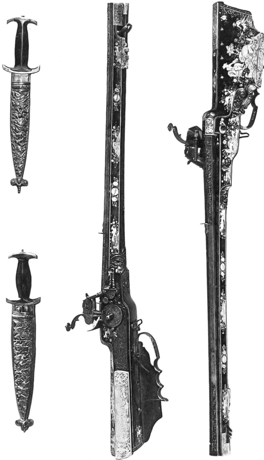
Schweizer Dolche und Jagdbüchse mit Radschloss aus der Sammlung Challande. (vgl. S. 22 u. 23.)