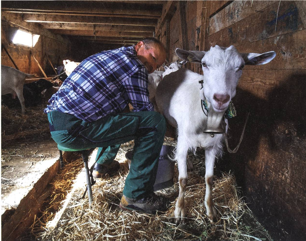
Neben den Kühen stehen auch einige Ziegen im Stall der Alphütte.

«Im Frühling kommt dieses Ziehen in der Seele. Wenn ich Anfang Mai zum ersten Mal nach der Winterpause wieder auf die Alp steige, ist das für mich der schönste Tag im Jahr. Auf den Weiden wächst bereits frisches Gras, und die ersten Blüten stossen hervor, während in den schattigen Ecken noch Schnee liegt. Das viele Schmelzwasser lässt die Bergbäche gewaltig anschwellen. Es rauscht nicht überall gleich. Speziell schön ist der Färrichbach. Eine ganz andere Melodie gibt es unten im Spiggegrund, dort hört man gleichzeitig drei grosse Wasserfälle.