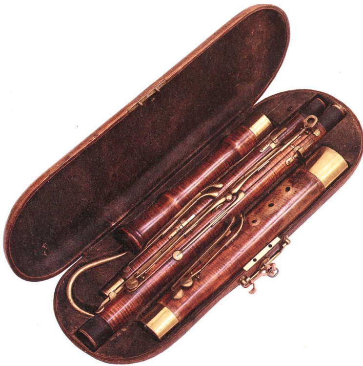
Fagott von Savary le jeune, Paris, datiert 1825, im Originalkoffer. Das Instrument erhielt Burri vom Musikalienhändler Krompholz, dessen Urgrossvater nicht nur das Geschäft in Bern gegründet, sondern im Berner Stadtorchester dieses Fagott gespielt hatte.

höchst innovatives Segment. Viele Musikerinnen und Musiker lernen historische Formen ihres Instruments zu spielen, Pianisten befassen sich mit dem Hammerflügel, Streicherinnen spielen wieder auf Darmsaiten und mit historischen Bögen und Paukisten mit originalen Fellen und Schlägeln.