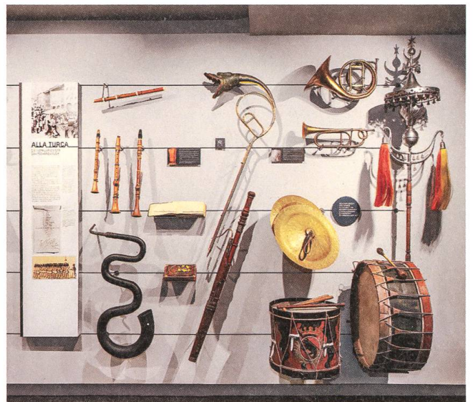
Eine «Türkisch Musik», u.a. mit Serpent von C. Baudouin, Paris, 1. Hälfte 19. Jh., und Drachenkopfposaune von Gebrüdern Hirsbrunner, Sumiswald, um 1830.

Und warum ist diese Trompete mit Klappen heute nicht mehr üblich?