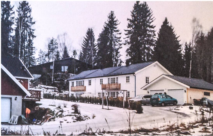
Wohnen am Waldrand