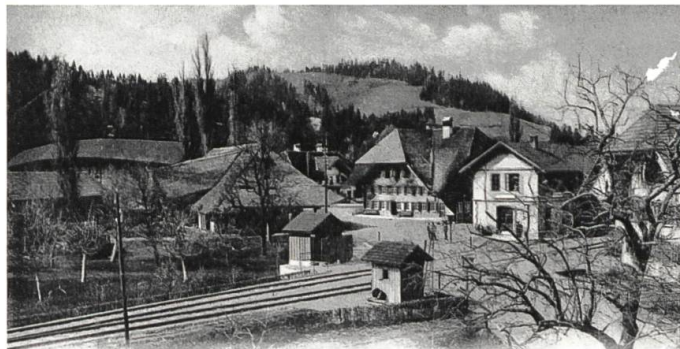
Der Bahnhof Zollbrück entstand 1881 mit dem Bau der Emmentalbahn. Links auf der Postkarte sieht man die alte Holzbrücke, die am 1. August 1947 abgebrannt ist.