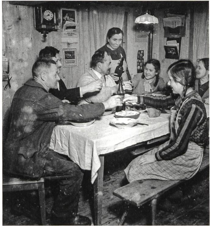
Am Abend des Schlachttages

Geschichtliche Dokumente über die Höfe in Rüderswil existieren bis heute nur über zwei, nämlich über den Hof Hertig im Unterfrittenbach, der in den «Berner Bauernhauschroniken» eingehend beschrieben wurde, und eine weitere Arbeit über die Familie Neuenchwander von Rüderswil, die aus Ranflüh stammt. Da die Gemeindegrenzen in Ranflüh