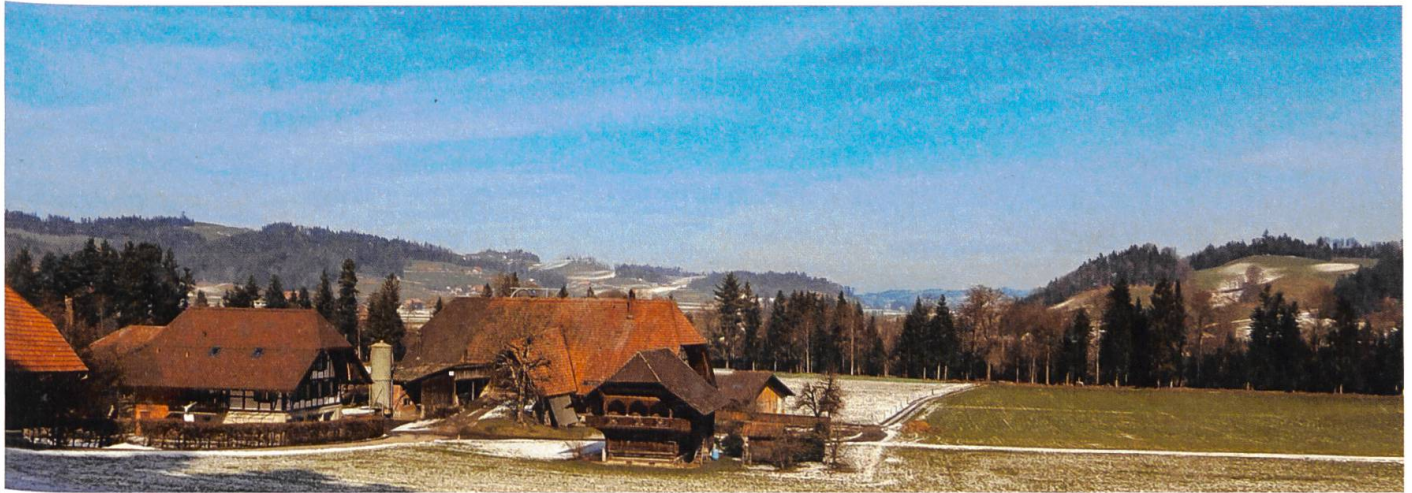
Der Hof Doggelbrunnen ist der älteste dokumentierte Bauernhof in Rüderswil.

sind die Eltern schon relativ alt, wenn es zur Ablösung kommt. Wenn nun aber die Eltern nicht loslassen können und dem Jungbauern ständig hineinreden, spricht man von der «Stöcklichranket». Dieser Ablöseprozess auf einem Bauernhof kann Probleme verursachen; aus Erfahrung weiss ich aber, dass das auch in einem Familienunternehmen anderer Branchen vorkommen kann. Ursprünglich waren diese Stöckli entweder Ofenhäuser oder Küherstöcke. Vor 1750 waren in den Bauernhäusern kaum je Backöfen vorhanden – schon wegen der Feuergefahr, aber auch weil die Herstellung von Brot nicht einfach ist, wenn man keine Hefe hat. Man errichtete also ausserhalb des Bauernhofes, meistens zusammen mit anderen Bauern, ein Ofenhaus, in dem die