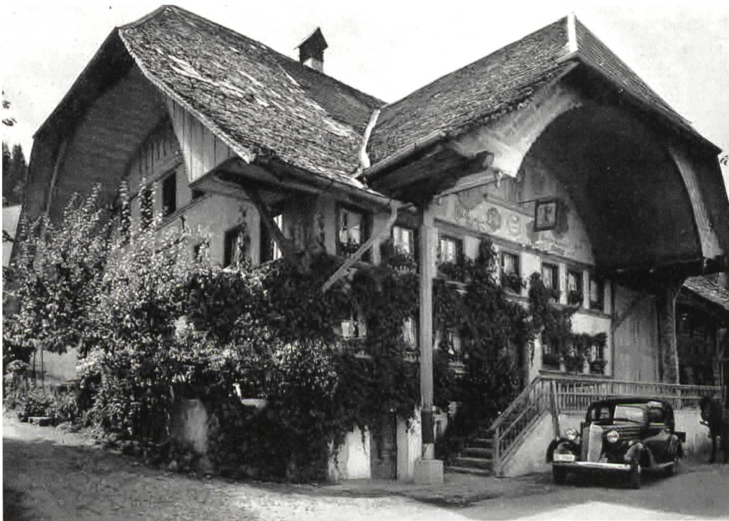
Der «Löwen» in Rüderswil