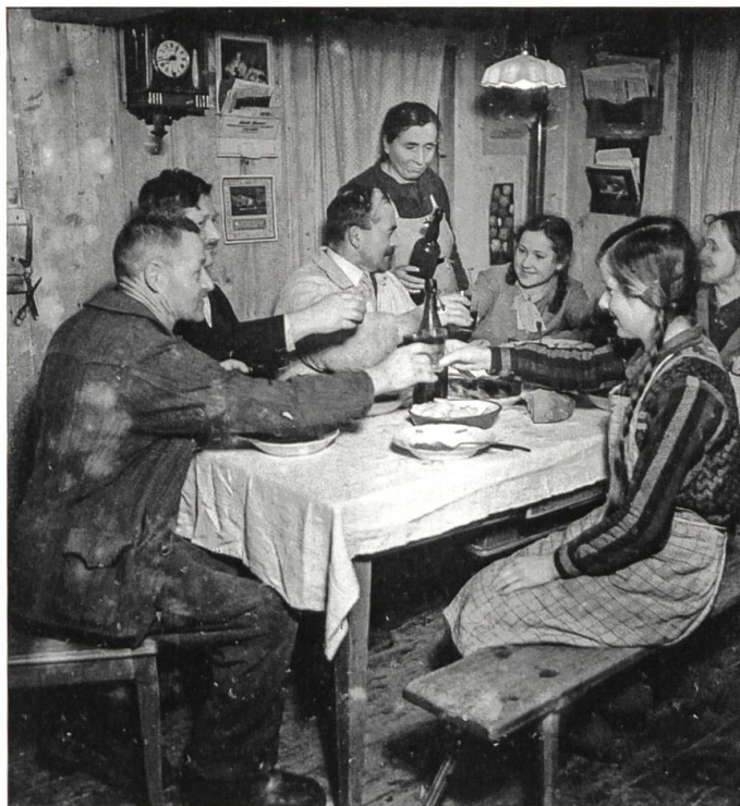
Am Abend des Schlachttages

Geschichtliche Dokumente über die Höfe in Rüderswil existieren bis heute nur über zwei, nämlich über den Hof Hertig im Unterfrittenbach, der in den «Berner Bauernhauschroniken» eingehend beschrieben wurde, und eine weitere Arbeit über die Familie Neuenchwander von Rüderswil, die aus Ranflüh stammt. Da die Gemeindegrenzen in Ranflüh