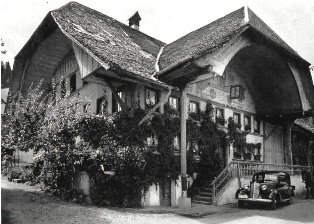
Der «Löwen» in Rüderswil

Was mich jedoch am meisten überrascht, ist die Tatsache, dass nur einige wenige Familien Wirte waren. Egal, wo man sucht, man wird fast immer die Familien Oberli, Dubach, Lanz oder Liechti finden. Auch im «Löwen» Rüderswil wie auch im «Bären» Ranflüh sind die Oberli von Rüderswil zu finden. In Rüderswil wurde 1567 mit der ersten Konzessionierung, die Bern offiziell erteilt hatte, eine Wirtschaft im Dorf bewilligt. 1743 sind in einem Schreiben von Bern zwei Wirtschaften erwähnt. Daraus geht hervor, dass die eine vis-à-vis des Pfarrhauses gewesen sein soll. 1804 wird erstmals der Name «zum Rothen Löwen» erwähnt. Das angebliche zweite Wirtshausrecht soll im 18. Jahrhundert nach Schwanden übertragen worden sein. Diese Wirtschaft, die heute auch nicht mehr existiert, wurde «Bären» genannt. Der «Bären» in Ranflüh ist dagegen schon im Jahr 1389 erstmals erwähnt worden, diente er doch als Gerichtshaus für das weltliche Gericht von Ranflüh. Der Galgen für die «bösen Buben» befand sich im Than. Die Gerichtsherren, der Henker und sein Knecht sowie der