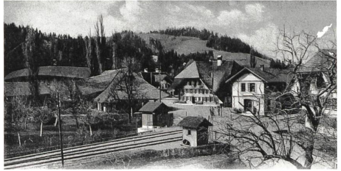
Der Bahnhof Zollbrück entstand 1881 mit dem Bau der Emmentalbahn. Links auf der Postkarte sieht man die alte Holzbrücke, die am 1. August 1947 abgebrannt ist.