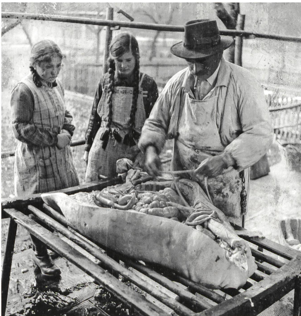
Alte Schlachtmethode

In diesem Zusammenhang versuche ich auch immer die noch existierenden alten Fotos zu sichern und zu archivieren. Es existieren viele Schätze, die man noch sichten und dokumentieren muss. Hier ein wichtiger Tipp an alle Leser, nicht nur an diejenigen, die sich für Rüderswil interessieren: Schreiben Sie auf die Rückseite der Fotos auf, wer darauf abgebildet ist und wann das Foto «geschossen» wurde!