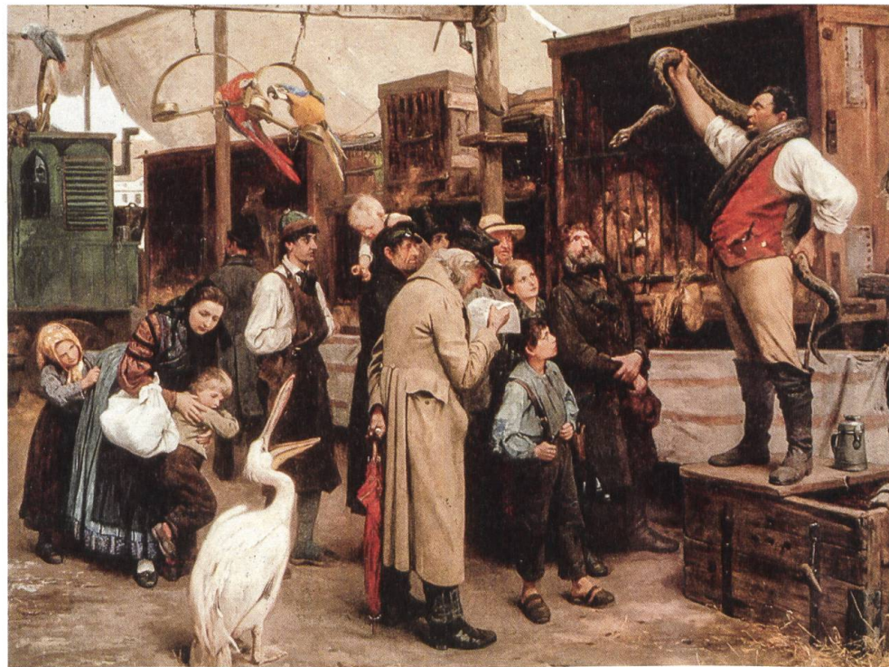
Die alten Menagerien (hier ein Gemälde von 1864) waren, im Gegensatz zu den grossen Tiergehegen des Altertums, spartanisch klein und mit engen Gitterkäfigen. (AZZT)

In neuerer Zeit und nachdem die Durststrecke der Kriegszeit überstanden war, änderte sich die Situation für die zoologischen Gärten gewaltig. Unter dem Druck zunehmender Naturbedrängnis und steigenden Umweltver-