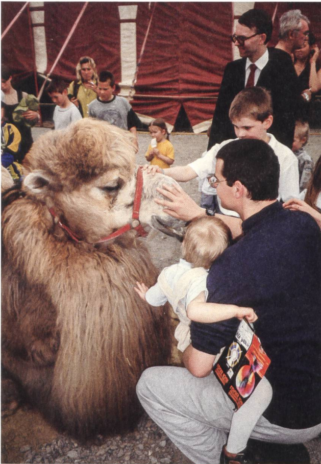
Im Zirkus ist noch inniger Kontakt mit den Exoten möglich, selbst zwischen ganz kleinen Menschen und ganz grossen Tieren; das heisst Tiere begreifen lernen. (AZZT)