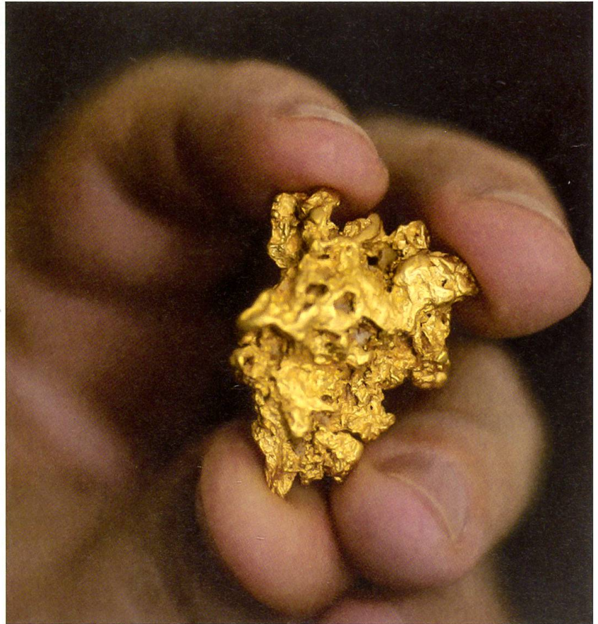
Ein Goldnugget in der Hand. Wer hätte es nicht gerne selber gefunden!

Man stelle es sich einmal so vor: 83 200 Barren, ein jeder gut zwölffeinhalb Kilogramm schwer und schlanke 25 Zentimeter lang. Herausgetragen aus den geheimnisumwitterten Tresoren der Nationalbank und direkt davor auf dem Berner Bundesplatz gestapelt, ergäbe diese Menge einen Turm von fast dreieinhalb Kilometer Höhe. Dessen zugegebenermassen doch sehr wacklige Turmspitze stünde nun Auge in Auge mit der schneebedeckten Spitze des 4042 Meter hohen Lauteraarhorns. Wahrlich, ein beeindruckend hoher Turm liesse sich also aufrichten, wenn die gesamten 1040 Tonnen Gold, die die Schweiz besitzt, zu dessen Bau verwendet würden. Bekäme jeder Schweizer und jede Schweizerin beim Abbau dieses Turmes seinen gleichen Anteil von knapp 167 Gramm an Gold, so entspräche dies der Goldmenge, die in 28 20-Franken-Goldvreneli enthalten ist.