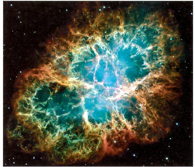
Der heute etwa 11 Lichtjahre grosse Überrest der Supernova vom 11. April 1054, genannt M1 im Sternbild des Stiers

serstoff und Helium vorhanden, wie nach dem Entstehen des Universums, sondern alle natürlich vorkommenden Elemente, inklusive des Goldes. Die Zeit vergeht, und in diesen Wolken ballt sich neuerlich die Materie zusammen und formt neue Sterne. Und oft bilden sich direkt neben den Sternen auch Planeten. So muss es gewesen sein, als sich vor viereinhalb Milliarden Jahren die Sonne gebildet hat. Und neben ihr entstand die Erde – der Ort, an dem wir leben, und der Ort, wo wir heute das Gold aus der Erde hervorklauben und es zu wunderschönen Dingen wie Schmuck oder einem Ehering verarbeiten: Gold, entstanden in einer Sternexplosion.