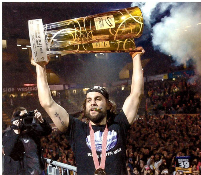
Sensationeller Durchmarsch des SCB durch die Playoffs

30. Mai: Das Solarflugzeug «Solar Impulse» von Pilot und Unternehmer Bertrand Piccard setzt seine in Abu Dhabi begonnene Weltumfliegung vom chinesischen Nanjing aus fort. Am 4. Juli landet das Flugzeug nach einem Weltrekordflug von Japan aus in Hawaii. Dort muss es wegen beschädigter Batterien mehrere Monate am Boden bleiben. Am 22. April nimmt Solar Impulse seine Reise wieder auf und erreicht von Hawaii aus das Silicon Valley in Kalifornien.