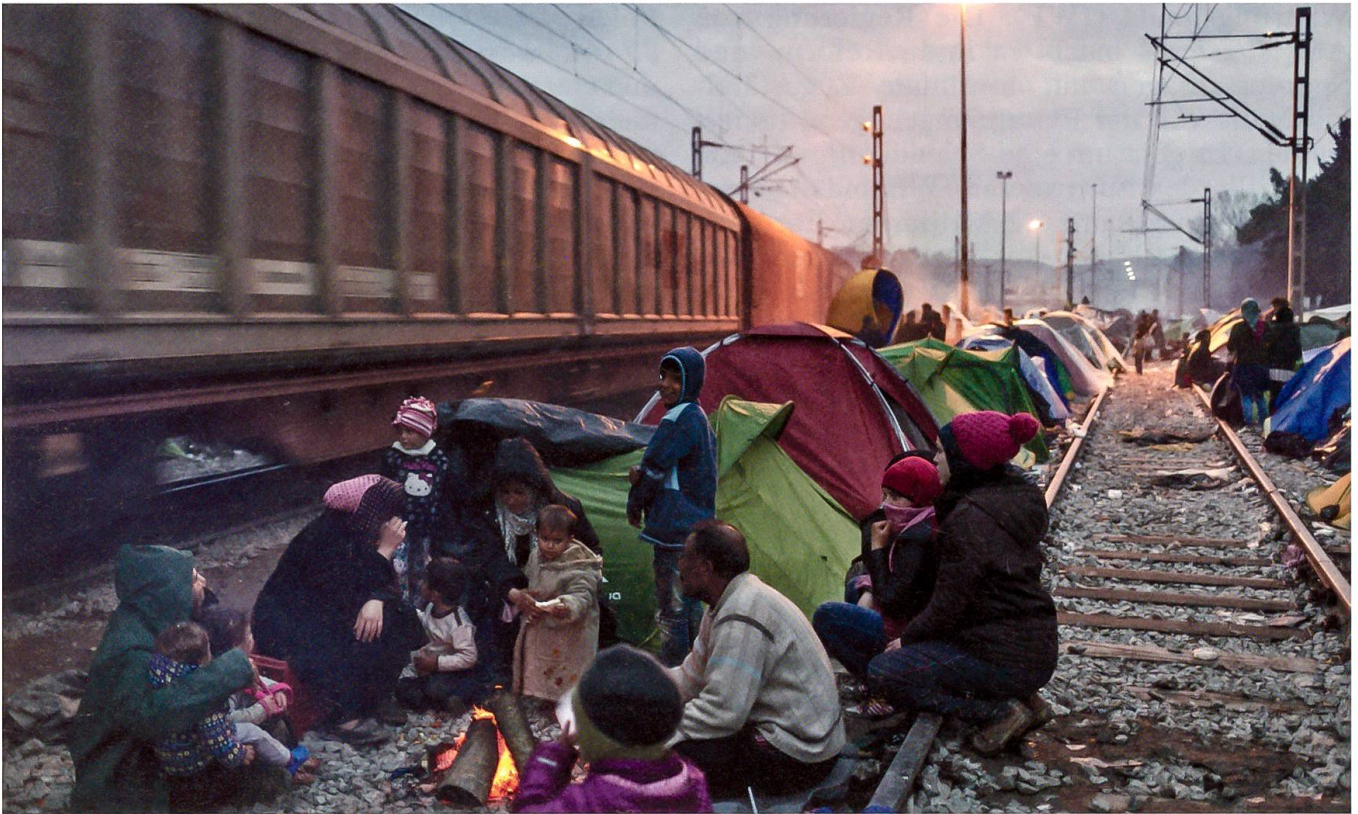
Bilder wie dieses machten zeitweise täglich auf das Flüchtlingselend aufmerksam.

nisterpräsident Matteo Renzi vorangetriebene Reformpaket gegen die trägen Politinstitutionen Italiens stimmen 179 Senatoren bei 16 Gegenstimmen und 7 Enthaltungen. Zahlreiche Senatoren der Opposition verlassen vor der Abstimmung den Saal.