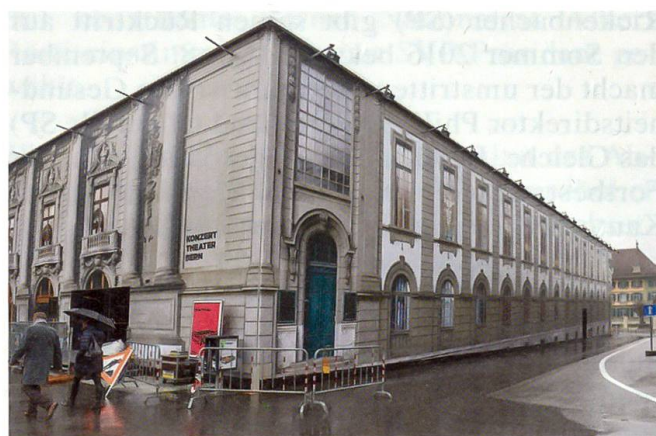
Kubus auf dem Waisenhausplatz, wo während der Sanierung des Stadttheaters gespielt wird

19. März: Mit einem Fest eröffnet Konzert Theater Bern einen provisorischen Kubus auf dem Waisenhausplatz, in dem während der Sanierung des Stadttheaters gespielt wird.