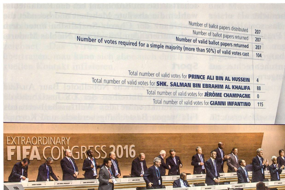
Wahl von Gianni Infantino zum neuen Präsidenten der arg gebeutelten FIFA

9. Oktober: Nach einem 7:0 gegen San Marino und dank der Niederlage des direkten Konkurrenten Slowenien qualifiziert sich die Schweizer Fussballnationalmannschaft vorzeitig für die Euro 2016 in Frankreich.