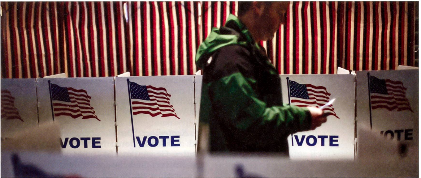
Die Vorwahlen zur US-Präsidentenwahl waren überaus spannend: Am Ende stehen sich Donald Trump und Hillary Clinton gegenüber.

8. Januar: Mexikos Polizei verhaftet Drogenboss Guzmán wieder. Auf seine Spur war sie gekommen, weil Guzmán sein Leben in Hollywood verfilmen lassen wollte und dafür Schauspieler Sean Penn für ein Interview im «Rolling Stone» traf.