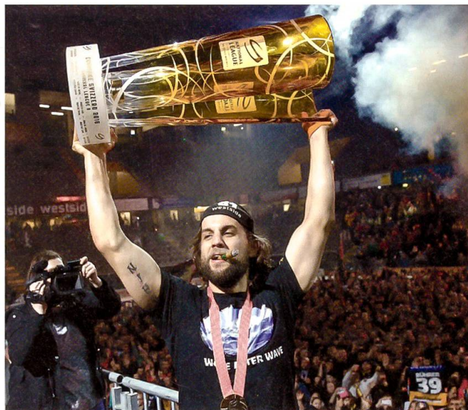
Sensationeller Durchmarsch des SCB durch die Playoffs

30. Mai: Das Solarflugzeug «Solar Impulse» von Pilot und Unternehmer Bertrand Piccard setzt seine in Abu Dhabi begonnene Weltumfliegung vom chinesischen Nanjing aus fort. Am 4. Juli landet das Flugzeug nach einem Weltrekordflug von Japan aus in Hawaii. Dort muss es wegen beschädigter Batterien mehrere Monate am Boden bleiben. Am 22. April nimmt Solar Impulse seine Reise wieder auf und erreicht von Hawaii aus das Silicon Valley in Kalifornien.