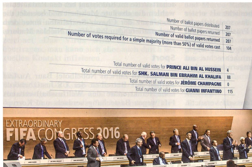
Wahl von Gianni Infantino zum neuen Präsidenten der arg gebeutelten FIFA

9. Oktober: Nach einem 7:0 gegen San Marino und dank der Niederlage des direkten Konkurrenten Slowenien qualifiziert sich die Schweizer Fussballnationalmannschaft vorzeitig für die Euro 2016 in Frankreich.