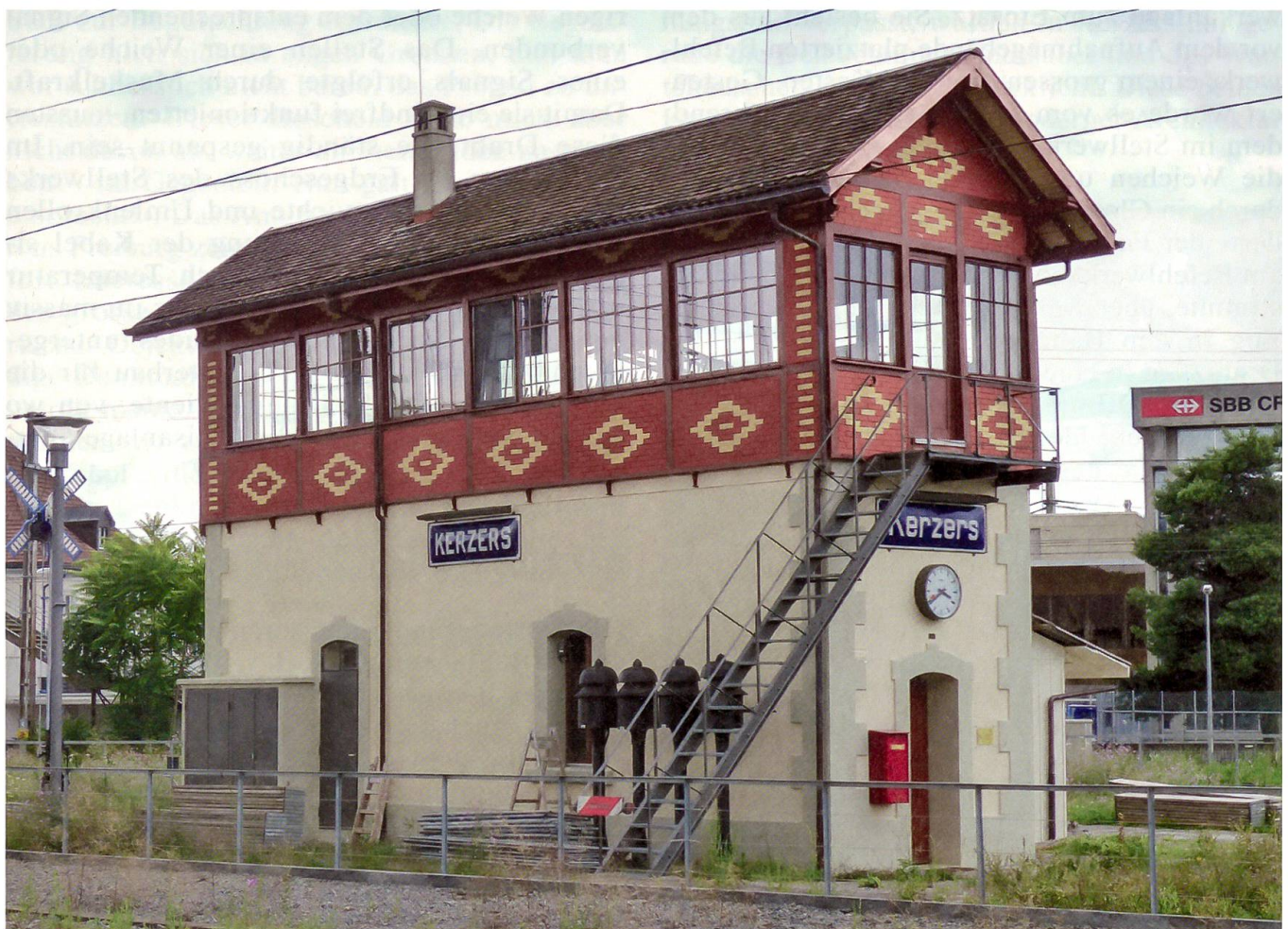
Das 1901 erbaute Stellwerkgebäude

die «Ligne directe» von Bern nach Neuchâtel in Betrieb genommen wurde. Deren Einführung in die bestehenden Bahnanlagen von Kerzers führte zum schweizweit einmaligen Schienenkreuz. Hier kreuzen sich zwei Bahnlinien im spitzen Winkel von 30 Grad. Auf diesen Zeitpunkt hin kam auch die von der Maschinenfabrik Bruchsal gebaute mechanische Stell-