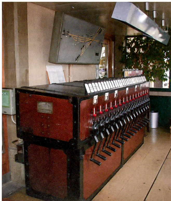
Der mechanische Kommandoapparat, Bauart Bruchsal G

bringen. Damit stiessen wir beim Projektleiter und bei den Planern verständlicherweise nicht immer nur auf Gegenliebe. Es brauchte viel Überzeugungsarbeit, Verhandlungsgeschick und beiderseits grosse Geduld, um die schliesslich realisierte Version der heutigen Publikumsanlagen sowie den Standort des neuen elektronischen Stellwerkes zu realisieren. Dank dem Amt für Kulturgüter gelang es auch, das gesamte Bahnhofensemble ins Inventar der «Regionalbahnhöfe von nationaler Bedeutung» aufzunehmen. Dadurch blieb das noch aus der Gründungszeit der Broyetallinie stammende Ensemble grösstenteils erhalten. Vom ursprünglich geplanten Facelifting im Rahmen des schweizweit zur Anwendung kommenden modularen Baukastensystems RV 05, mit dem die SBB den Regionalbahnhöfen ein neues Erscheinungsbild verpasst, wurden in Kerzers nur gerade die Beleuchtungskandelaber und das Wartehäuschen aus Glas verwirklicht. Diese beiden Elemente fügen sich trotz moderner Architektur harmonisch ins Ganze ein.