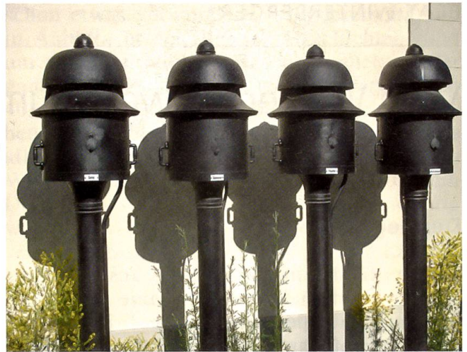
Einst auf jedem Bahnhof anzutreffen: das Läutwerk

werkanlage zum Einsatz. Sie besteht aus dem vor dem Aufnahmegebäude platzierten Befehlswerk, einem grossen eisernen Kasten. Gesteuert wurde es vom Fahrdienstleiter, währenddem im Stellwerkgebäude der Stellwerkwärter die Weichen und Signale bediente. Für den durch ein Glockensignal angemeldeten Zug forderte der Fahrdienstleiter mittels einer Kurbel am Befehlswerk eine Fahrstrasse an, d.h., er bestimmte, über welche Weichen und Gleise der Zug in den Bahnhof geführt werden sollte. Drahtzüge in einem Schacht unter den Gleisen der Broyetallinie leiteten diesen Befehl ins Stellwerkgebäude, wo er an der Fahrstrassenhebelgruppe angezeigt wurde. Damit wusste der Stellwerkwärter, welche Weichenhebel an der Hebelbank er zu bedienen hatte. Ein Verschlussapparat im Befehlswerk verunmöglichte das Freigeben «feindlicher» Fahrstrassen. Ebenso verhinderte die Verschlussvorrichtung unterhalb der Hebelbank, dass eine angeforderte Fahrstrasse im Stellwerk falsch eingestellt wurde: Nur wenn die waagrechten Fahrstrassenlineale und die senkrechten Verschlusschieber korrekt zueinander standen, liess sich ein Signal öffnen. Durch diese gegenseitigen Abhängigkeiten wurde die Einfahrt eines Zuges auf ein bestimmtes Gleis zuverlässig gesichert.