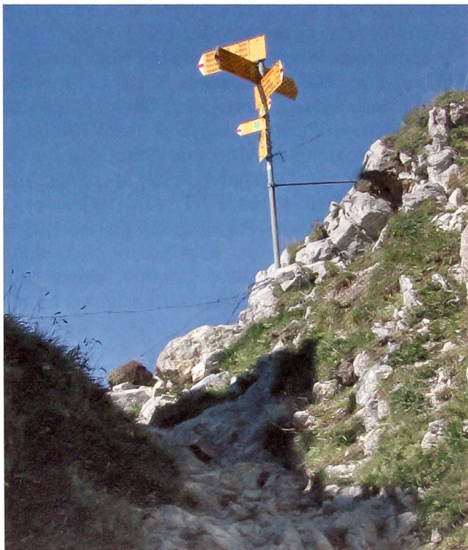
Morgetepass, 1959 m ü. M.

Ziemlich genau in der Mitte liegt er, auf dem Weg aus dem Gantrischgebiet im Berner Mittelland hinüber ins Simmental im Berner Oberland, auf der Gemeindegrenze zwischen Guggisberg und Oberwil i.S., auf einer Höhe von knapp unter 2000 Metern über Meer: der Morgetepass. Und als solcher liegt er auch fast genau in der Mitte zwischen dem ehemaligen mächtigen Gurnigelbad und den ehemaligen grossen Weissenburgbädern, dem hinteren und dem vorderen. An die vier Stunden beträgt der Weg zu Fuss sowohl vom einen wie vom andern ehemaligen Heilbad hinauf zum Passübergang. Komfortabel bringt der öffentliche Ver-