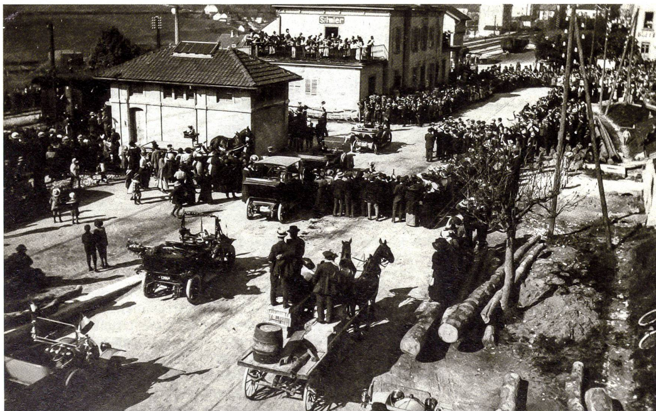
Der begeisterte Empfang der Internierten am 17. Mai 1916 in Saint-Imier

stellt. Die Leute drängen sich auf den Strassen zusammen, sie stellen sich auf die Böschungen und die Dächer, um besser zu sehen. Als der Schnellzug um 8.39 Uhr in den Bahnhof einfährt, spielt das lokale Musikkorps die Marseillaise. Zwanzig Fahnen sind über dem Bahnsteig aufgehängt. Kinder tragen riesige blau-weiss-rote Blumensträusse. Überall ruft man «Vive la France!». Die Internierten antworten mit «Vive la Suisse!». Der Empfang ist so grandios, dass der Pressekorrespondent in der Abendausgabe von «Le Jura bernois»