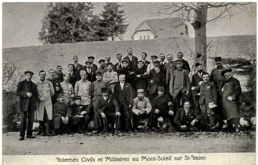
Sobald die Zivil- und Militärinternierten auf dem Sonnenberg angekommen waren, fotografierte man sie und machte aus dem Bild eine Postkarte. Die Soldaten tragen eine Uniform, die Zivilmänner einen Anzug. (Mémoires d'Ici, Fonds Oliver Wileczelek)

Marianne Walle, «Les prisonniers français internés en Suisse 1916-1919», La Suisse et la guerre de 1914-1918. Actes du colloque tenu du 10 au 12 septembre 2014 au Château de Penthes, ss la dir. de Ch. Vuilleumier, Genève; Editions Slatkine, 2015, p. 151-173.