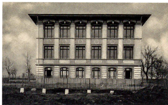
Das Sekundarschulhaus von 1905

sechs bis sieben Klassen im 7. bis 9. Schuljahr. In der Kirchgemeinde Höchstetten war früh ein Bedürfnis nach einer erweiterten Elementarschule vorhanden, und so fand am 11. Oktober 1856 in einer denkwürdigen Kirchgemeindeversammlung die Gründung der Sekundarschule statt. Sie hat wie die Primar- und Realschule während der mehr als 150 vergangenen Jahre ihres Bestehens viele Änderungen durchgemacht. Entscheidend waren der Bezug der neuen Schulanlage im Jahr 1972 und dann die Veränderung von der fünf- auf die nur noch