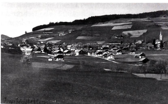
... und vor 100 Jahren

Das heutige Gemeindegebiet war schon früh im 13. Jh. für die Landwirtschaft erschlossen. In der Dorfgenossenschaft, aber auch in Einzelwirtschaft wurde der Boden genutzt und bebaut. Man hielt sich an das bewährte Bewirtschaftungssystem (Dreizelgenwirtschaft mit Scheidezäunen). – Bis ins 18. Jh. kamen die einheimischen Landnutzer im Vorsommer zusammen und diskutierten miteinander über Fragen, die sich für sie immer wieder stellten, während längerer Zeit sogar alle Monate.