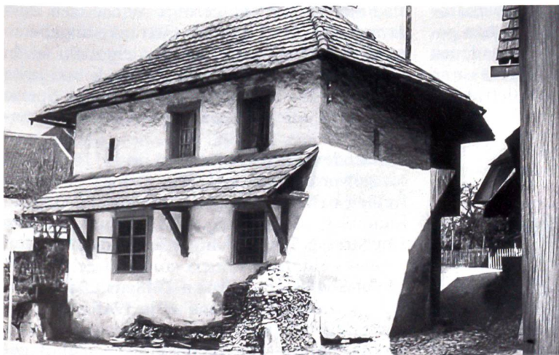
Das «Chefeli», einstiges Distriktsgefängnis, machte 1924 einer Neuüberbauung Platz.

Das Rhynhaus steht im Rückraum des Gasthofs «Löwen». Es ist ein ehemaliges Grossbauernhaus, ursprünglich natürlich noch mit Rauchküche. Der Kernbau ist wohl um 1630 entstanden. Die vier unter dem riesigen Dach