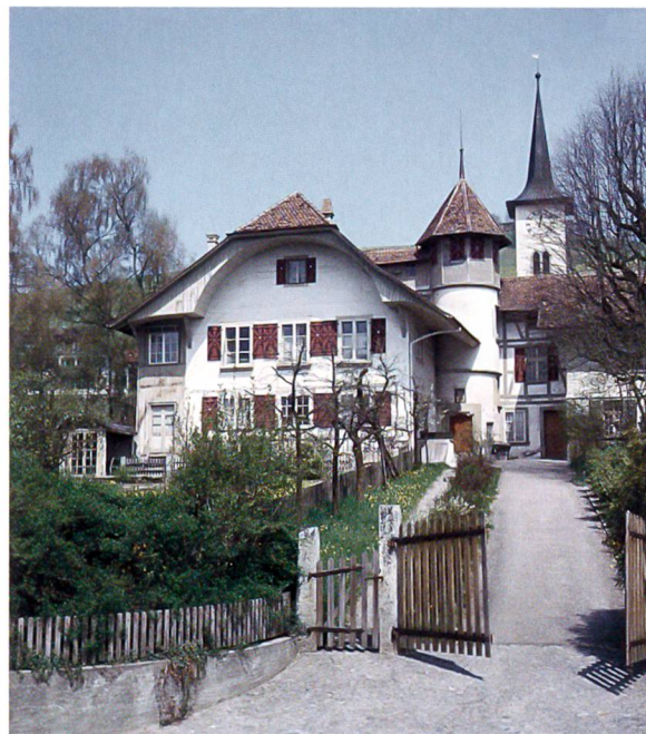
Pfarrhaus und Kirche

Als seine Amtszeit als Landvogt auf Schloss Signau 1631 zu Ende gegangen war, erbaute Petermann von Erlach das heutige Pfarrhaus, das stattliche Schlössli, als Sommersitz. Seine Nachkommen verkauften es 1669 dem Staate Bern. Es ersetzte das baufällig gewordene Pfrundhaus am Kirchstutz Nr. 8, das wahrscheinlich vor der Reformation den Pfarrherren als Domizil gedient hatte und heute zwei moderne Wohnungen enthält.