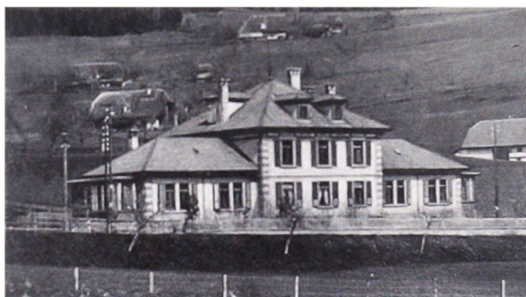
Das alte Spital von 1896

tenentwicklung im Gesundheitswesen kam es zur Schliessung kleinerer Spitäler. Trotz guter Bewertung punkto Auslastung, Leistung, Führung, Infrastruktur und Lage wurde dasjenige in Grosshöchstetten aufgrund von politischem Kräfteressen als eines der ersten geschlossen, ohne dass unser Gemeindeverband etwas dazu hätte sagen können. Der Vorwurf dem Regierungsrat gegenüber lässt sich nicht wegstecken, dass man in Grosshöchstetten in den letzten Jahren des 20. Jh. ein Spital planen und mit ungeheurem Aufwand bauen liess, obwohl sicher längstens bestimmt war, dass es dann auf der Spitalliste gestrichen werden sollte.