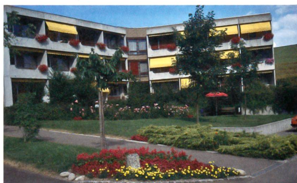
Das Alters- und Pflegeheim aus dem Jahre 1977

Im September 1977 konnten die ersten Pensionärinnen und Pensionäre im Alters- und Pflegeheim Grosshöchstetten einziehen. Die Trägerschaft, Pro Senectute Amt Konolfingen, Verein für das Alter, bietet seitdem in einem ständig erneuerten und gepflegten Heim 100 Mitarbeiterinnen und Mitarbeitern attraktive Voll- und Teilzeitstellen an. Aus dem ursprünglichen Altersheim mit 71 Einzelzimmern und Hotelbetrieb ist nunmehr ein Pflegeheim geworden. Der inzwischen bereits zur Tradition gewordene jährliche «Tag der Begegnung» wird jeweils für Jung und Alt, Angehörige und Gäste, Einheimische und Auswärtige zum wertvollen Erlebnis.