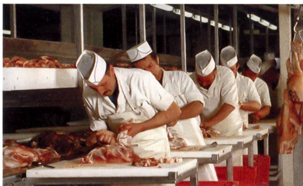
Bis vor wenigen Jahren beschäftigte die Grossmetzgerei Gerber 300 Angestellte.