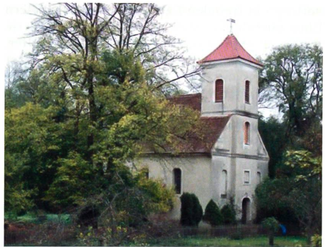
Die Friedensreich-Kirche, die älteste Kirche der Stadt Potsdam überhaupt, Zeugnis und Denkmal der Einwanderung von Berner Familien um 1690

Nachdem den Inspektoren Nachbesserung versprochen worden war, reisten sie mit einem solchen bestätigenden Schreiben des Kurfürsten im November 1684 zurück nach Bern.