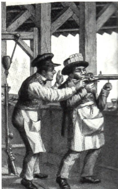
Standeschütze (1830–1850) mit seinem Lader (Windschmöcker), ihm die Stärke und Richtung des Windes zuflüsternd oder auch ihn auf ein allfälliges unruhiges Zielverhalten aufmerksam machend und bereit, im richtigen Moment den Hahnsteller des Stutzers zurückzulegen, als Zeichen für den Schützen, dass er nun abdrücken möge.

Waffe hatte beinahe die Auflösung des jungen Schützenverbandes zur Folge: Die Anhänger des Standstutzers wollten die alten Distanzen beibehalten. Die Handhabung des Feldstutzers war aber einfacher und das Nachladen nicht mehr so kompliziert. Daher einigte man sich auf einen Kompromiss und bildete zwei Abteilungen: die Standschützen und die Feld- oder Militärschützen.