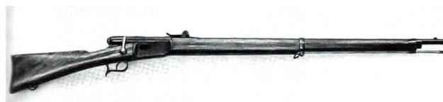
SIG Neuhausen, Repetiergewehr Vetterli 1869

1712 sind fast alle Berner Truppen mit dem Schiessgewehr bewaffnet. Die Zeit der Armbrust und der Langspiesse geht dem Ende entgegen. Aber auch bei den Gewehren findet eine Modernisierung statt. Die Vorderladergewehre werden abgelöst durch Repetiergewehre, die nicht mehr für jeden Schuss neu geladen werden müssen. Das Kaliber der Vorderladergewehre betrug 18 mm, das des Vetterli-Gewehrs 10,5 mm.