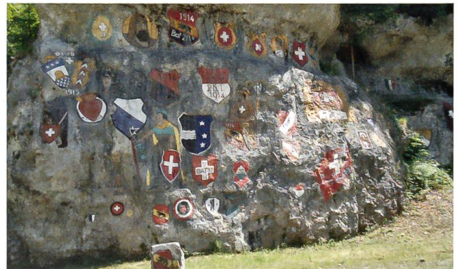
Chessiloch bei Grellingen BL: Wehrmänner gestalteten im Ersten Weltkrieg diesen Wappenfelsen.

kam der Kriegsausbruch überraschend. Eben noch hatte man die Sommerfrische genossen, jetzt wurde mobilisiert, die Grenzen wurden geschlossen. Tausende, die in den Schweizer Ferien- und Kurorten die Hotels füllten, reisten Hals über Kopf ab, gährende Leere zurücklassend. Wenige kamen wieder – nach Jahren. Aber auch die ausländischen Arbeitnehmer, die Studenten, sie alle fuhren weg in ihre Heimatländer, wo die meisten sogleich eingezogen wurden. Viele Auslandschweizer kehrten heim, bereit zum Dienst für das Vaterland. Die Landesausstellung in Bern, eine eindrucksvolle Schau des schweizerischen Volkstums und der