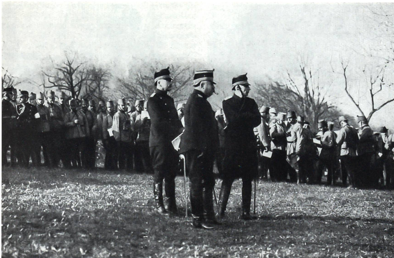
Die Schweizer Armeespitze im Ersten Weltkrieg: General Wille, flankiert von Generalstabschef von Sprecher (r.) und Generaladjutant Brügger