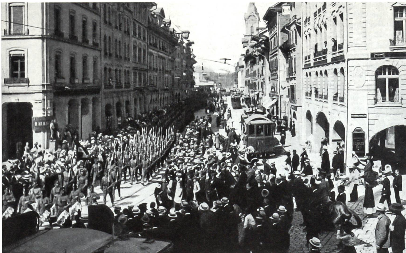
Truppénéfilée in Bern

steller Carl Spitteler am 14. Dezember 1914 in Zürich bei der Neuen Helvetischen Gesellschaft hielt. Deutlich hielt er fest: Jenseits der Grenze wohnen Nachbarn, diesseits der Grenze aber Brüder. Das ist ein gewaltiger Unterschied. Und: Freundschaft mit Nachbarn ist gut in Friedenszeiten, aber jeder kriegführenden Macht ist zu misstrauen. Sind wir als Demokraten nicht eher Geistesverwandte der französischen Republik als der deutschen Monarchie? Und: Die Feinde des deutschen Reichs sind nicht unsere Feinde. Angesichts des Trauerspiels ist für uns einzig ergriffenes, demütiges, ernstes Schweigen das richtige Verhalten. Die Rede wurde weitherum zur Kenntnis genommen. Spitteler aber wurde von da an in Deutschland für immer zur Unperson, während man ihn früher hoch gelobt hatte.