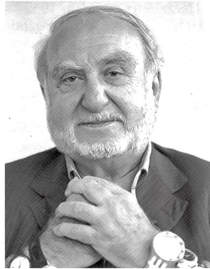
Nicolas G. Hayek Gründer der Swatch Group, Ehrenbürger von Biel † 28. Juni 2010