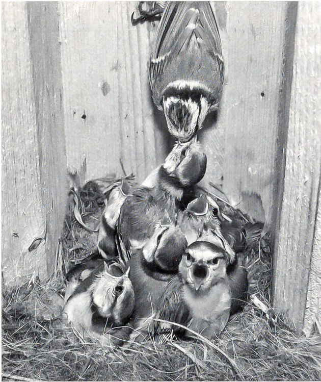
Ein Wunder, wie trotz Wirrwarr alle zur ihrer Ration Futter kommen.

suchungen ergaben, dass die Intensität dieser Sprenkelung Rückschlüsse auf den Gesundheitszustand des Weibchens erlauben. Nach 13 bis 15 Tagen Brutdauer schlüpfen die winzigen, nackten Wesen.