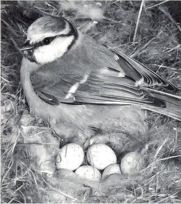
Ein Eilein wiegt gut ein Gramm; das Gelege mehr als die Vogelmutter.

Wir beobachten und bewundern sie – die Jahr für Jahr emsig für ihre Jungen Futter eintragenden Vogeleltern; doch sind wir uns bewusst, was sich da alles abspielt?