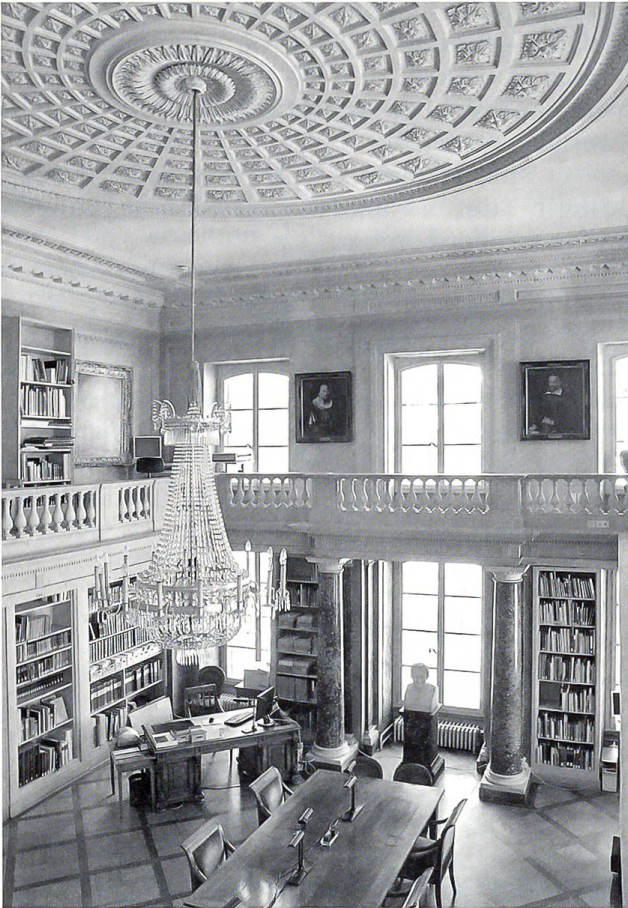
Lesesaal der Burgerbibliothek

Der um 1790/92 erschaffene Lesesaal der Burgerbibliothek ist ein Hauptwerk der frühklassizistischen Innenarchitektur in Bern.