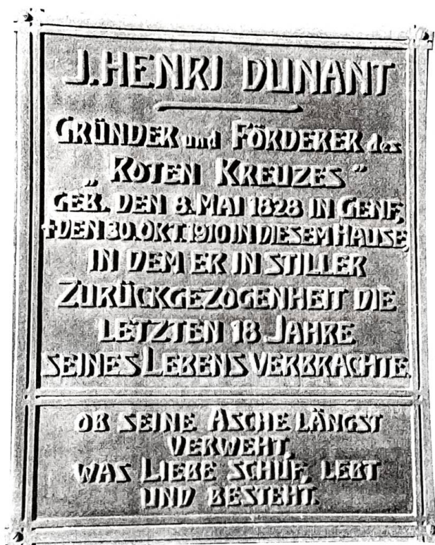
Am Eingang des Bezirksspitals Heiden erinnerte während 50 Jahren diese Bronzetafel an Henry Dunant, der die letzten 18 Jahre seines Lebens in diesem Hause verbrachte.