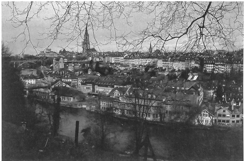
Das Mattequartier, im Vordergrund die Aare, im Hintergrund die Berner Altstadt mit dem Münster

Am meisten Betrieb herrschte bei der Schifflaube, dem Umschlagplatz für die ländlichen Erzeugnisse. Hier wohnten auch die Flösser und Schiffer. Sie transportierten Lebensmittel, Baumaterialien, Brennholz und Vieh aus dem Berner Oberland in die Stadt. Die «Märitschiffe» hiessen noch um die Mitte des 19. Jh. «Kälberflotte». 1825 legten in der zweiten Jahreshälfte 623 Schiffe mit 6162 Personen und 11 400 Zentnern Waren an. Die 1859 eröffnete Eisenbahnlinie Bern–Thun brachte einen spürbaren Rückgang der Schifffahrt und die Aarekorrektion von 1876 schliesslich das Ende.