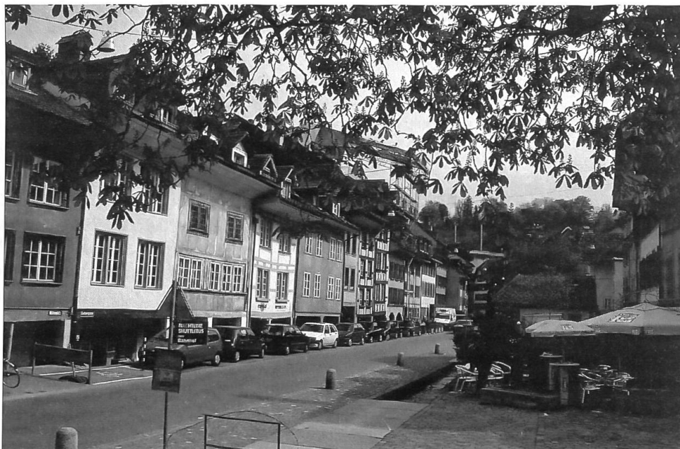
Strassenzug mit renovierten Häusern und Mattenbach in der Mitte

den Flössern als Selbstschutz – keine Drittperson verstand sie – eingeführt.