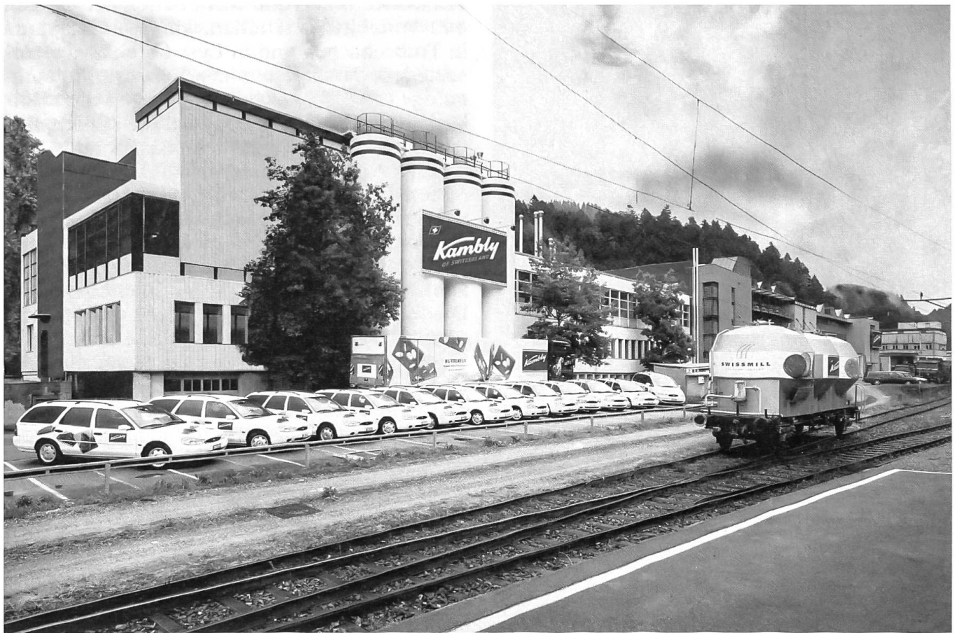
Das Fabrikationsgebäude in Trubschachen

zeugen davon, dass die Qualitätsansprüche nicht nur beteuert, sondern in der täglichen Arbeit als Spiegel der inneren Haltung erfüllt werden.