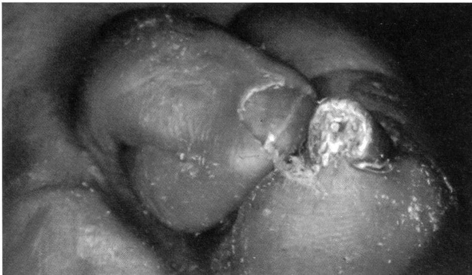
Der schmerzhaft Pinzettennagel

Unsachgemäss und viel zu kurz geschnittene Zehennägel können einwachsen und