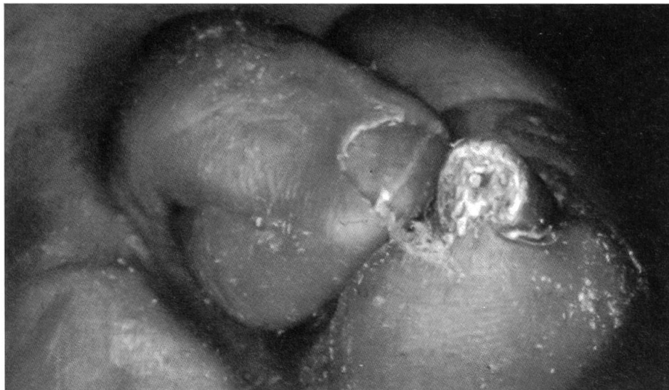
Der schmerzhafte Pinzettennagel

Hornhautrisse und Rhagaden (Rhagade = Schrunde, Riss in der Haut) an der Ferse entstehen auf Grund von gestörter Schweisssekretion und Fehlbelastungen. Der verhornte Rand der Rhagade ist sehr hart und muss durch den Podologen abgetragen werden, damit eine Heilung stattfinden kann. Unbehandelte Hornhautrisse und Rhagaden können zu Infektionen führen, die sehr schmerzhaft sind.