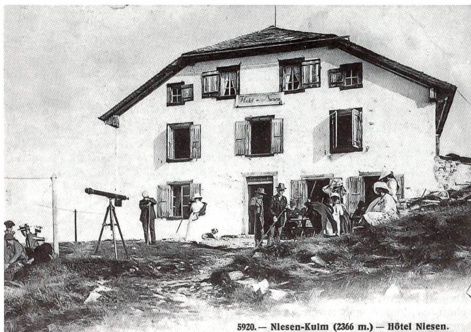
5920. — Niesen-Kulm (2366 m.) — Hôtel Niesen.

Ein weiterer blühender Wirtschaftszweig waren die Bäder mit ihren Heilquellen aus dem Schiefergestein des Niesens. Das bekannteste unter ihnen ist wohl das Bad Heu-