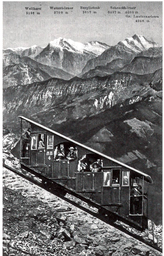
Der alte Bahnwagen, ganz in Holz gebaut, um 1918

Der Bau der Niesenbahn war zwar gut gelungen, das schlechte Wetter der ersten Betriebsjahre verhinderte jedoch den gewünschten Erfolg. Der drohende Ausbruch des Krieges brachte die Niesenbahn vollends aus dem Gleichgewicht und am 6. August 1914 sogar zum Stillstand. Der drohende Konkurs konnte dank zähem Kampf abgewendet werden, und 1915 wurde der Bahnbetrieb wieder aufgenommen. Es harzte jedoch weiterhin, und erst ein durchgreifender Plan zur Entschuldung