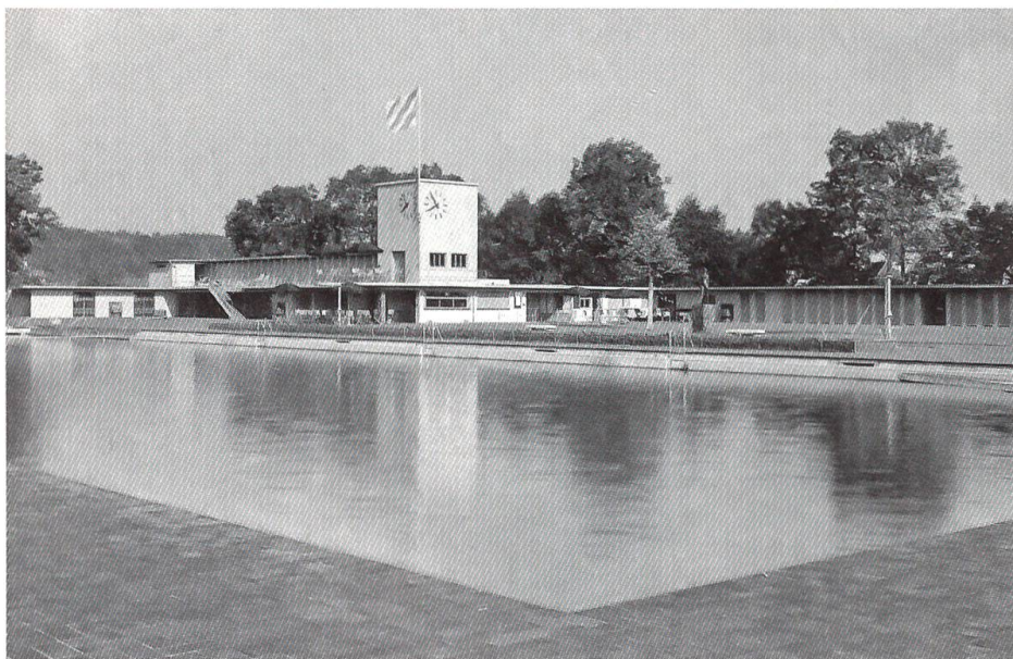
Schwimm- und Sonnenbad Langenthal, 1931–33

Hector Egger war von Kindsbeinen an im Baugewerbe verwur-