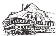
Gasthof «zum Kreuz» Sumiswald

Jass- und Wanderwochen ..... Fr. 650.-/570.- Edelweiss-Pauschale ..... Fr. 590.- 1 Woche inkl. HP, Wanderpass für Bergbahnen und Grillplausch