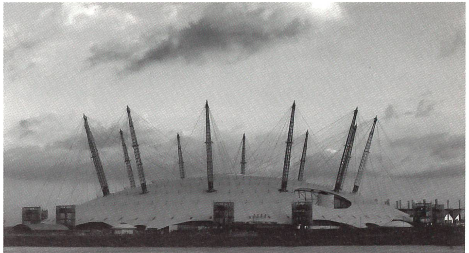
Mit dem Britain-Millennium Dome entstand rund 150 Jahre später ein ähnlich gigantisches Bauwerk in London.

1) Rohstoffe und Erzeugnisse, welche bis jetzt Gegenstände der menschlichen Industrie sind, nach den Naturreichen geordnet; 2) Maschinen für Ackerbau, Fabrik- und Manufakturwesen; 3) Erzeugnisse des Fabrik- und Manufakturwesens; 4) Plastische Kunstwerke. ... Als Ort, an welchem das Ausstellungsgebäude errichtet werden sollte,