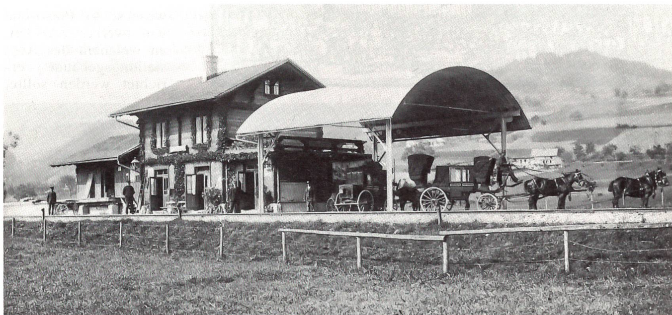
Die Station Thurnen an der 1901 eröffneten Gürbetalbahn. Mit den Pferdekutschen ging die Reise weiter zum Gurnigelbad.

Wegen Bergsturzgefahr wird der bisherige Standort des