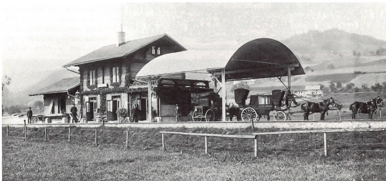
Die Station Thurnen an der 1901 eröffneten Gürbetalbahn. Mit den Pferdekutschen ging die Reise weiter zum Gurnigelbad.

Wegen Bergsturzgefahr wird der bisherige Standort des