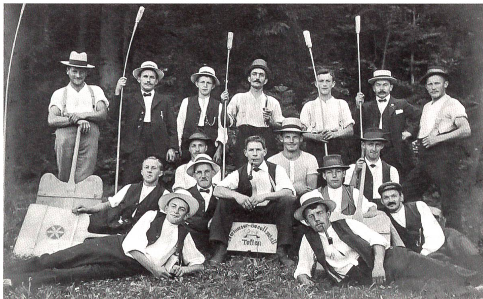
Die Hornussergesellschaft Toffen im Jahre 1920

«Nummer» schlechtschreiben lassen. Die Mannschaftsleistung des «Abtuns» ist gegenüber der Einzelleistung des Schlagens höher bewertet.