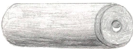
Das «Träf» vorne am Stecken wiegt zwischen 220 und 360 Gramm und besteht aus gepresstem Holz.

Jedem «Schläger» steht die gesamte gegnerische Mannschaft gegenüber, die sich mit ihren «Schindeln» ausgerüstet auf das Spielfeld verteilt. Die 60 mal 60 Zentimeter messenden «Schindeln» sind aus Holz und wiegen etwa 4 Kilo. Sie werden dem herannahenden «Nouss» entgegengeschleudert, mit dem Ziel, ihn auf seinem Flug zu stoppen. Gelingt das nicht, muss sich die Defensivmannschaft eine