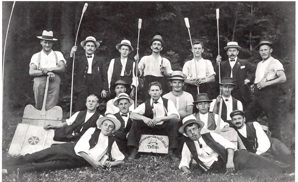
Die Hornussergesellschaft Toffen im Jahre 1920

«Nummer» schlechtschreiben lassen. Die Mannschaftsleistung des «Abtuns» ist gegenüber der Einzelleistung des Schlagens höher bewertet.