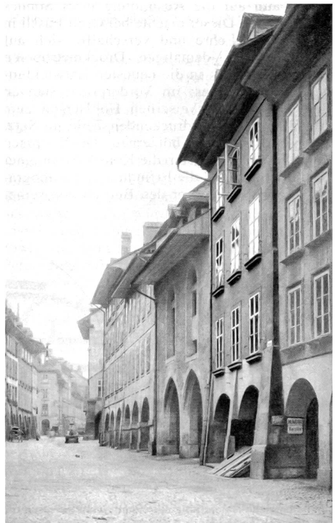
Das alte Druckereigebäude an der Postgasse

Obwohl es offensichtlich an Kritik aus der Leserschaft nicht fehlte und sich meine Zensoren oftmals über meinen Inhalt mokierten, fand ich in einem grossen Kreis gute Aufnahme, und auch später, als das Kalenderprivileg wegfiel, vermochte ich mich gegen meine Herausforderer, von denen die meisten längst das Zeitliche gesegnet haben, durchzusetzen.