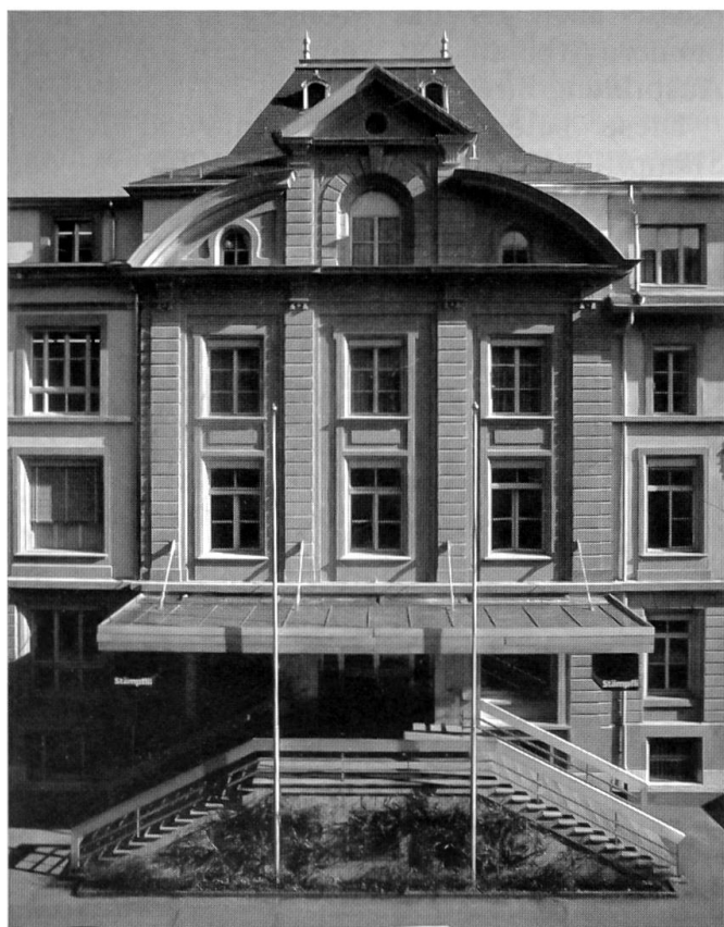
Fassade des heutigen Gebäudes der Stämpfli AG, Grafisches Unternehmen

In der Mitte unseres Jahrhunderts begann der Offsetdruck, der bisher von spezialisierten