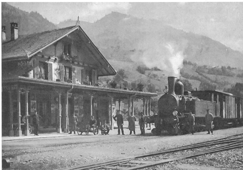
Bahnhof Erlenbach in den Anfängen der Spiez–Erlenbach-Bahn

Zum Rechtsanwalt kam ein Zigeuner und bat um Rechtsbeistand. Er war des Diebstahls angeklagt.