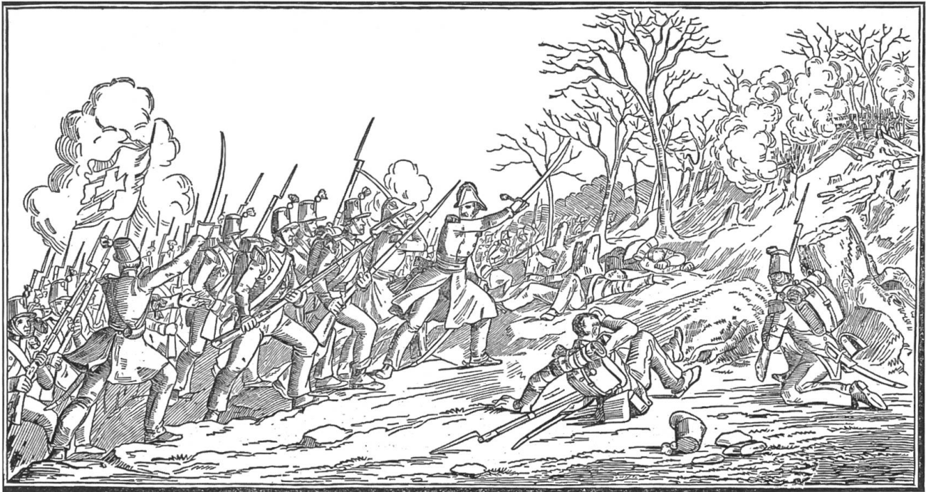
Sonderbundskrieg: Schlacht bei Gisikon im luzernischen Reusstal

in der Nacht vom 23. Wintermonat die Übergabe der Stadt Luzern. Anschliessend an die Besetzung der schwyzerischen March in den folgenden Tagen kapitulierten auch Schwyz, Unterwalden, Uri und Wallis. Den Schluss des Berichts bildete folgender Satz: «Hoffen wir, und tragen wir alle das unsrige nach Kräften dazu bei, dass fortan nie mehr im Vaterlande Bruderblut vergossen werden müsse.»