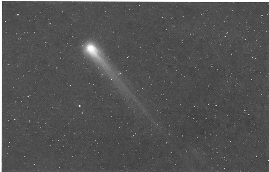
Der Komet Hyakutake in Erdnähe

Mit einem Schlag waren unsere Befürchtungen wie weggeblasen, ja wir schämten uns geradezu, auf derart abwegige Gedanken ge-