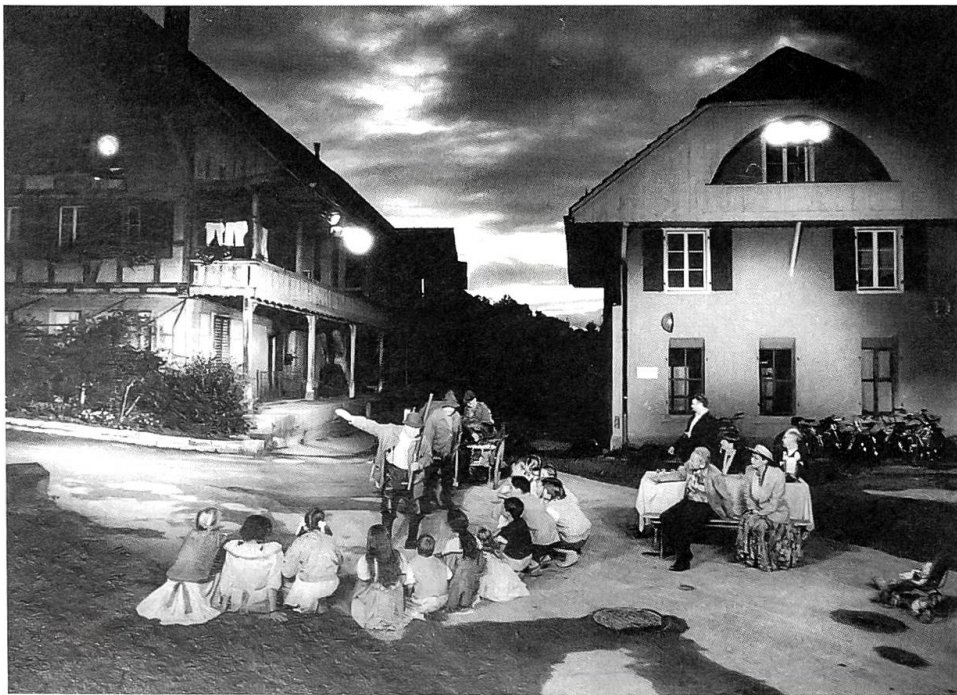
Grosser Erfolg für das «Schärmespiel» in Ittigen Sämtliche Vorstellungen dieser Freilichtaufführung mit Laienschauspielern waren innert weniger Tage ausverkauft. Verfasser des stimmungsvollen Stückes ist Hans Stalder aus Ittigen.

dem Dachgiebel aufgehängt bewahrte. Auch ein Heidenhaus bei Wattenwyl hat einen Ochsenkopf aufzuweisen. Bei anderen ist in Erinnerung an den wirklich vorhandenen natürlichen Ochsenkopf ein anderer als Ersatz aus dem Holz ausgehauen und gilt als Schutz vor Feuer und Blitz. In Radelfingen hatten mehrere der ältesten Häuser noch vor kurzem und haben zum Teil noch heute unter dem Strohdachfirst grosse Ochsenköpfe mit Hörnern. Man sagt, die Heiden hätten damit die Häuser vor Feuer sichergestellt.