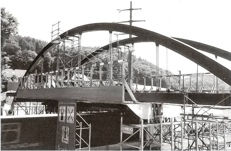
Neues Stadttor für Bern

Zuoberst auf der Kuppe der Autobahn im Grauholz wurde diese Stahlkonstruktion erstellt, die die bisherige Brücke ersetzt.