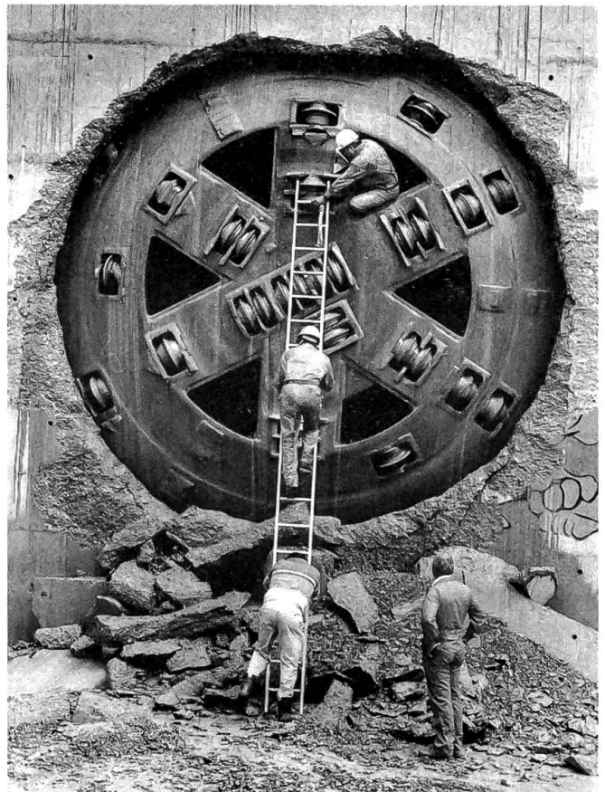
SBB-Grossbaustelle im Grauholz – Durchstich im Grauholztunnel

Ich blieb ganz ruhig. «Sie haben selbst die Wahl», sagte ich, «wenn sie die Spritze nicht bekommt, stirbt sie...» Der Lappe zögerte. Ich