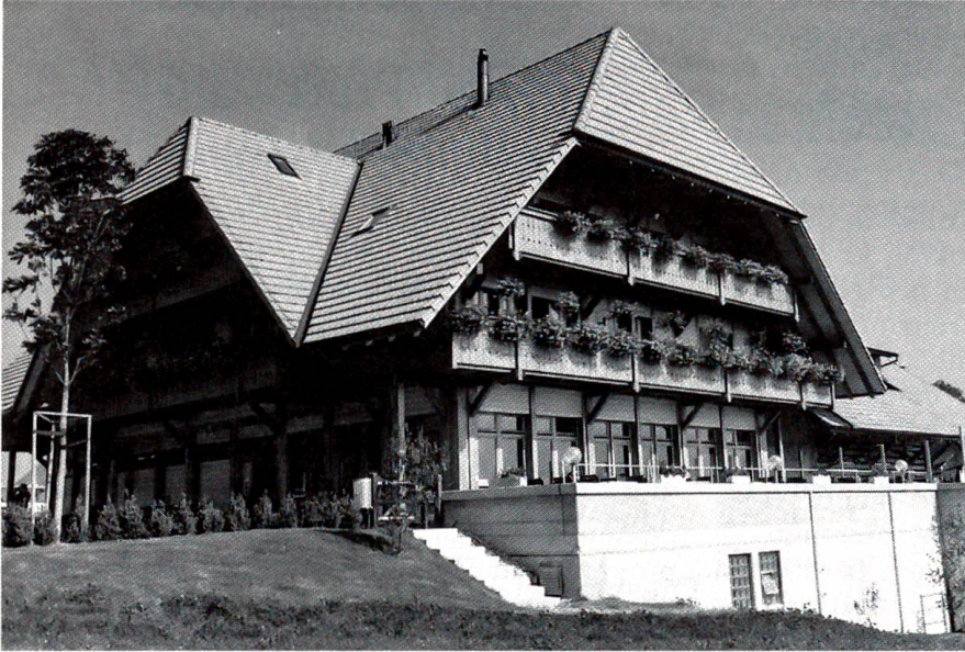
Die Ementaler Schaukäserei in Affoltern i. E.

Zur Erstellung dieses imposanten Holzbaues mit einem typischen Ementaler Dach wurden 142 m 3 einheimisches Holz verwendet, was dem Verbrauch von gegen 100 ausgewachsenen Tannen entspricht.