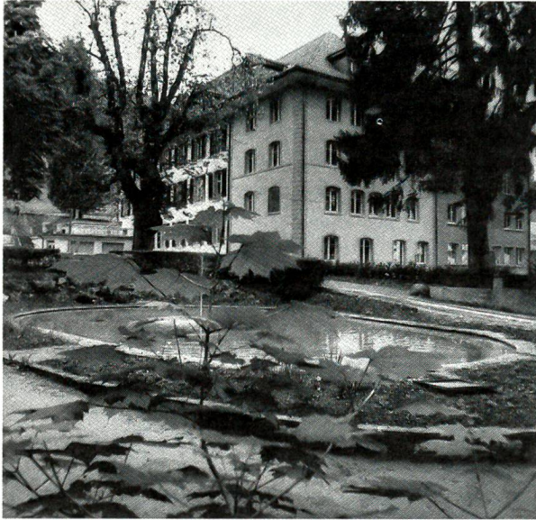
Oberried in Belp

Nach umfassender Renovation und Umbau ist hier ein psychogeriatrisches Heim eröffnet worden.