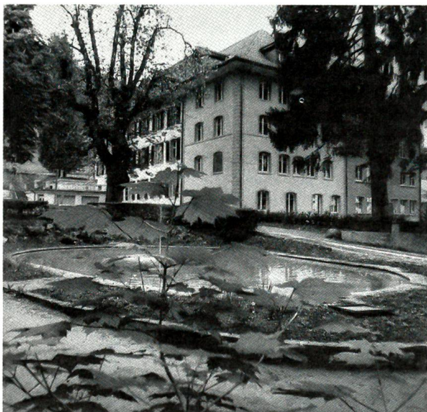
Oberried in Belp

Nach umfassender Renovation und Umbau ist hier ein psychogeriatrisches Heim eröffnet worden.