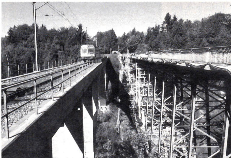
Sanierung der Schwarzwasserbrücke