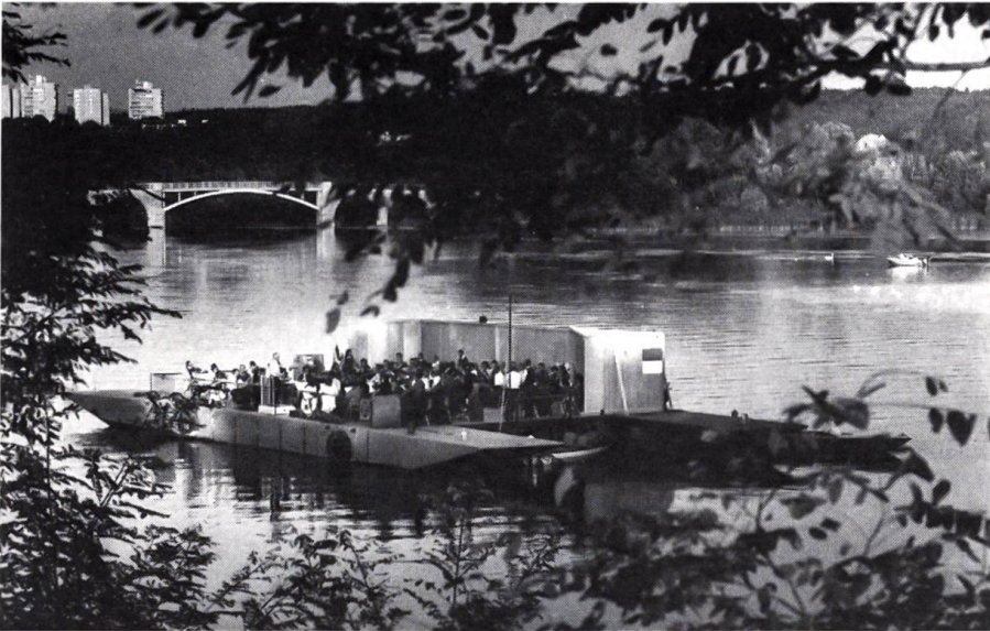
Händels «Wassermusik» auf dem Wohlensee

Zum Abschluss einer Sommeraktion spielte das Berner Symphonieorchester auf einem Floss im Wohlensee. Dem originellen Konzert war ein grosser Zuhörer- und Zuschauer-Erfolg beschieden.