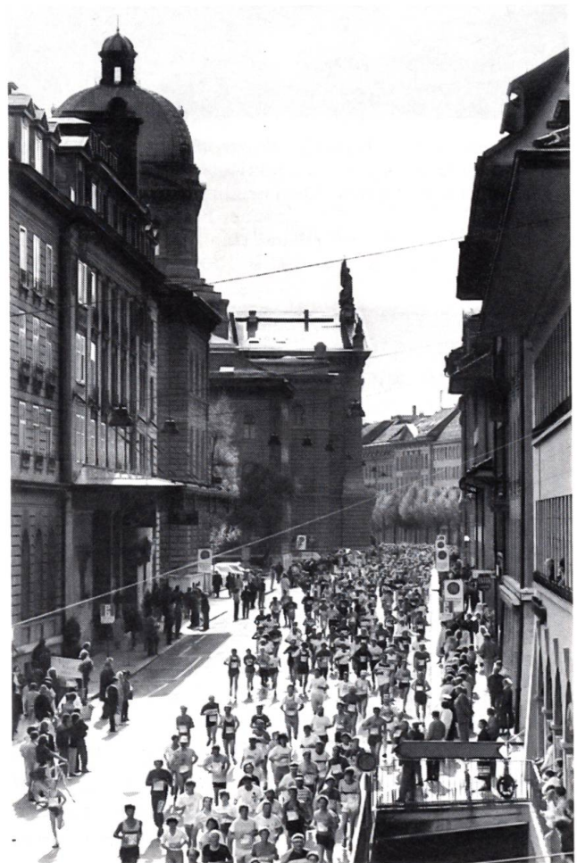
Grand-Prix von Bern 1987

Im Wallis hat man früher an den Herdfeuern der Sennen und an den langen Winterabenden in den Wohnstuben und Ställen nicht nur Sagen von unheimlichen Begegnungen und Erscheinungen erzählt, das Volk hatte auch sein Vergnügen an Geschichten sehr