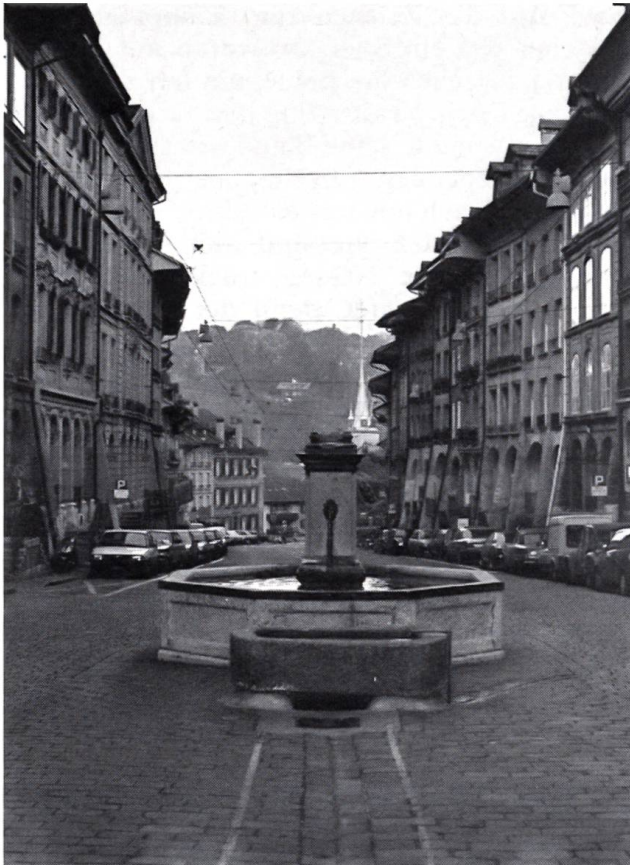
Zerstörung des Gerechtigkeitsbrunnens in Bern Zu dieser Schandtat äusserte sich der Grosse Burgerrat von Bern wie folgt:

«Wir verurteilen den niederträchtigen Anschlag vom 13. Oktober 1986 aufs schärfste. Was die revolutionäre französische Besatzungsmacht anno 1798 nicht tat, führten die Täter vom 13. Oktober aus: Sie zerstörten die schönste Brunnenfigur aus dem 16. Jahrhundert, ein unersetzbares Original. Die mit Vorsatz ausgeübte Zerstörung von Kulturgut ist nicht nur Vandalismus übelster Sorte, sondern Terrorismus, was allen Schweizern zu denken geben sollte.»