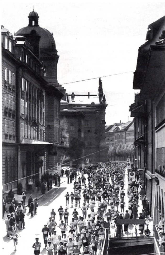
Grand-Prix von Bern 1987

Im Wallis hat man früher an den Herdfeuern der Sennen und an den langen Winterabenden in den Wohnstuben und Ställen nicht nur Sagen von unheimlichen Begegnungen und Erscheinungen erzählt, das Volk hatte auch sein Vergnügen an Geschichten sehr