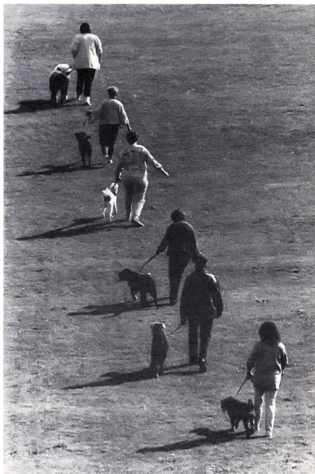
Wie der Meister, so der Hund Kurse für Vierbeiner und ihre Besitzer werden überall angeboten. Leider soll es noch viele Hundebesitzer geben, die vom Angebot keinen Gebrauch machen.

Von weitem gesehen, wird die Stadt Annecy vom Schloss Nemours beherrscht und gekrönt: einer Masse alter Mauern, viereckiger Türme und Zinnen. Bei Sonnenuntergang nimmt es lilafarbene und violette Tönungen an. Aus der Nähe gesehen, ist es ein majestätisches,