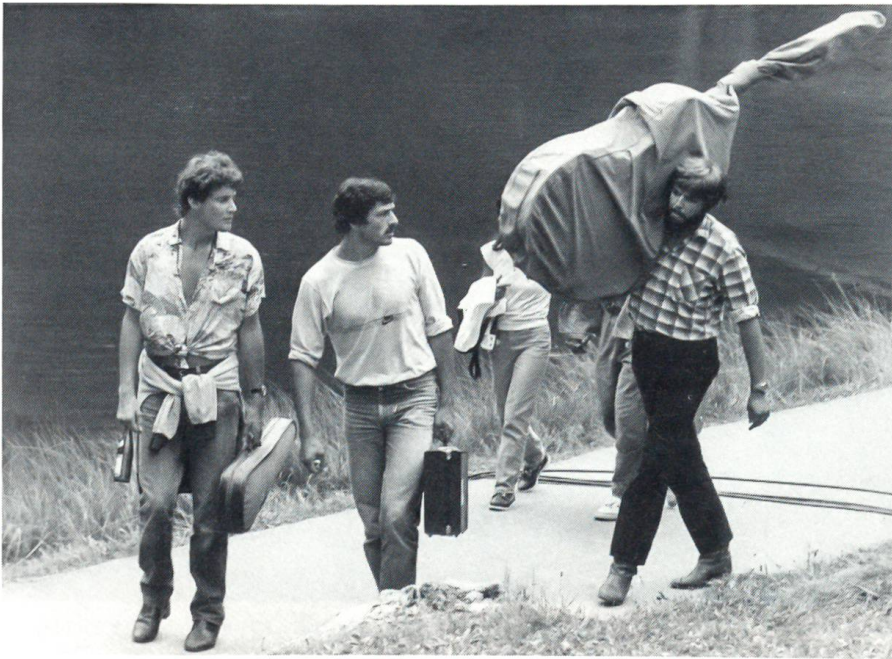
Folkfestival am Blausee Aufmarsch der Musiker

hielt. Die Laternen wurden angezündet, Rucksack, Pickel und Seil an sich genommen, und berggewohnte Schritte verklangen im langsam erwachenden Tag. Am Fensterchen kauern sah ich sie übers Geröll hin bergwärts verschwinden, und in diesem Augenblick wusste ich es plötzlich ganz fest. Spürte die unerschütterliche Gewissheit, dass ich nicht bereit war, zu verzichten auf das Erleben am Berg, sondern dass ich die Kraft haben musste, in Zukunft mit jedem angstvollen Gedanken sofort fertig zu werden.