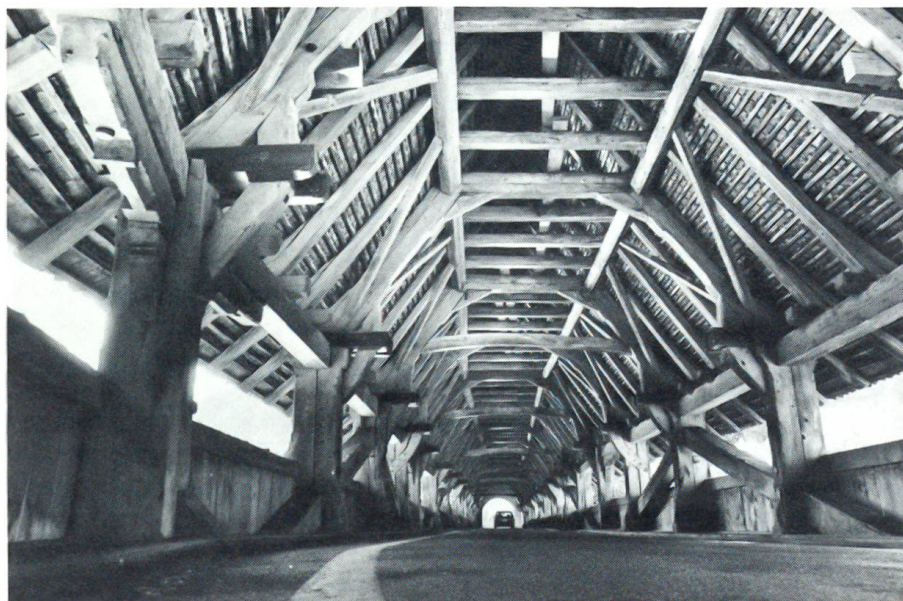
Renovation an der Neubrücke

«Ich fürchte mich vor diesem Aufstieg», gestand ich schliesslich voller Unbehagen. Ungläubig schauten sie mich an. Dann nahm der eine lachend seine Pfeife aus dem Mundwinkel, legte freundschaftlich seine Hand auf Bens Schulter: «Wer sich vor einer solchen Bergtour ängstigt, der sollte besser zu Hause